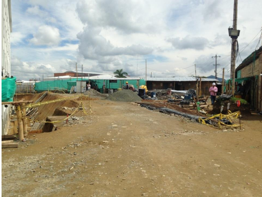
Figura 16. Predio para Biblioteca en Urbanización San Joaquín