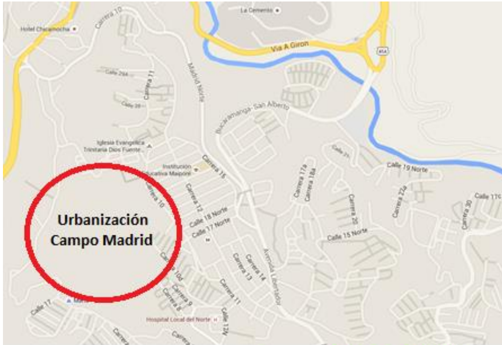
Figura 3. Localización Urbanización Campo Madrid