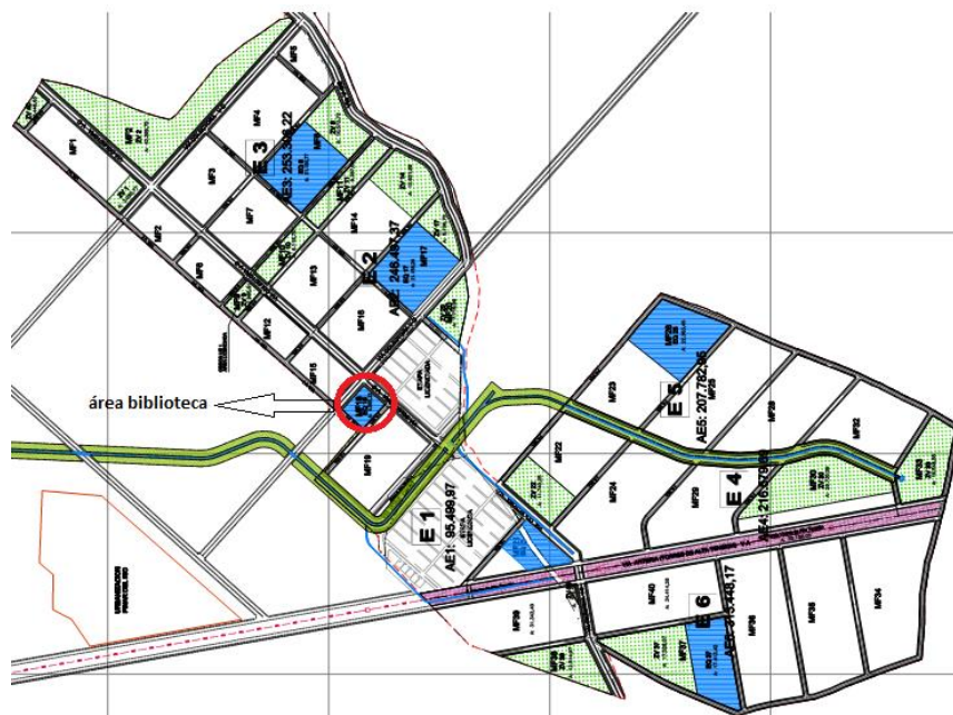
Figura 8. Localización predio biblioteca - Urbanización Villas de San Pablo