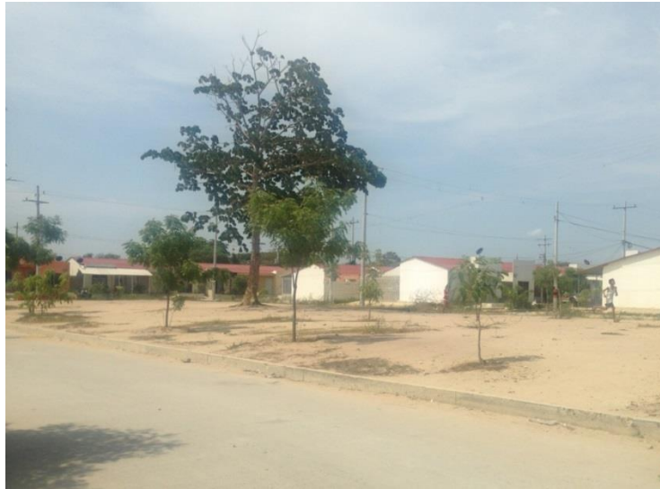
Figura 3. Predio para Biblioteca en Urbanización Villa Olímpica