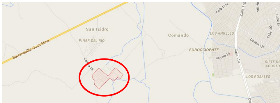
Figura 7. Localización Urbanización Villas de San Pablo