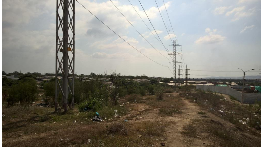
Figura 6. Predio para Biblioteca en Urbanización Gardenias