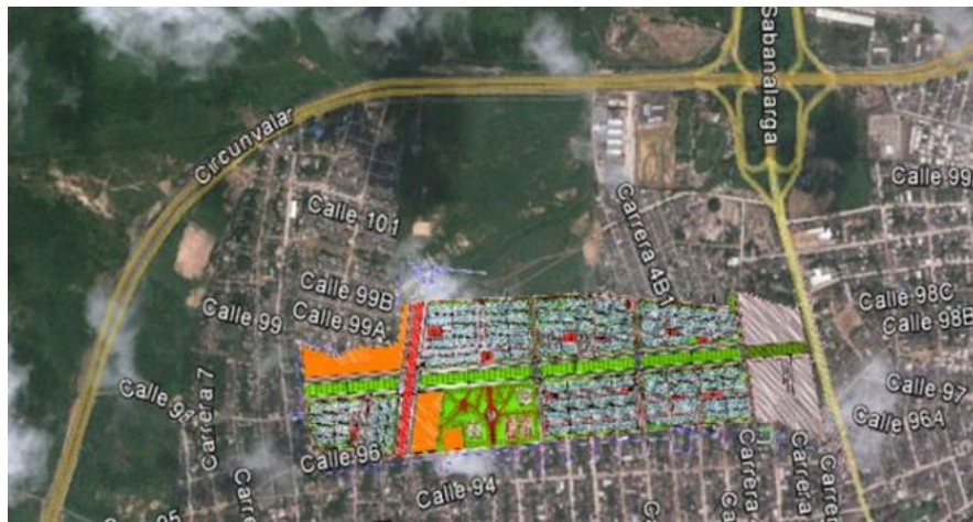
Figura 4. Localización Urbanización Gardenias