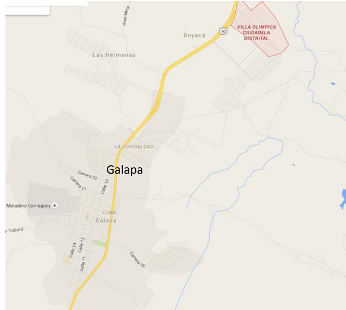
Figura 1. Localización Urbanización Villa Olímpica