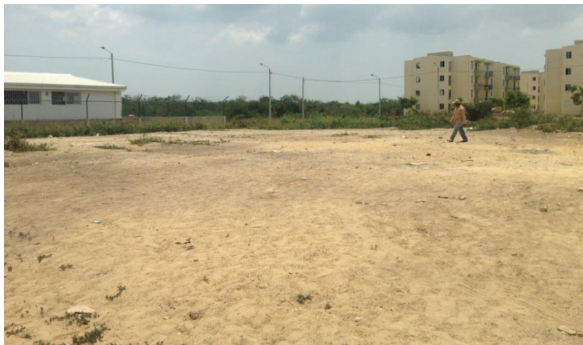
Figura 9. Predio para Biblioteca en Urbanización Villas de San Pablo