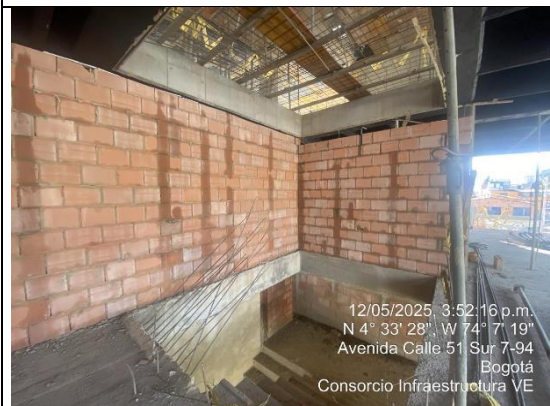
Instalación de mampostería 12/05/2025