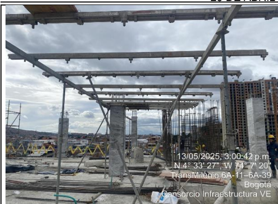
Inicio de armado de placa de cubierta 13/05/2025