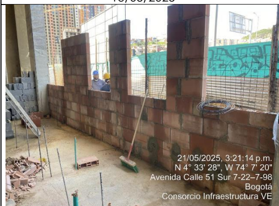
Armado de muros fachada 21/05/2025