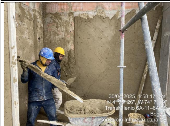
Instalación de pañete 30/04/2025