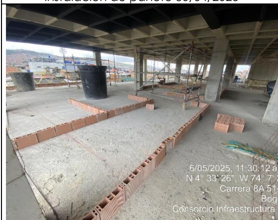
Armado de muros 06/05/2025