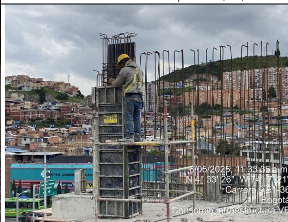
Armado de columnas 4 piso 06/05/2025