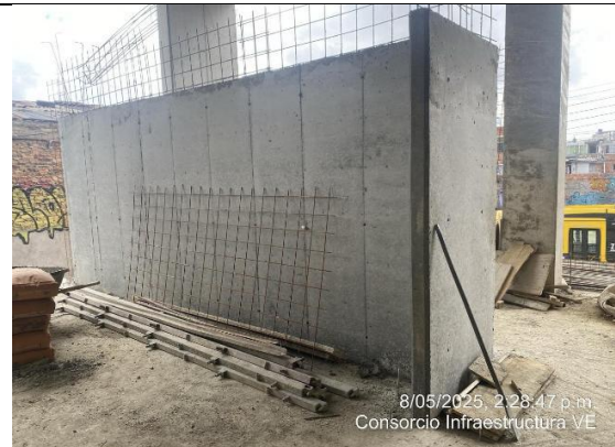
Fundida muros salas de paso 08/05/2025