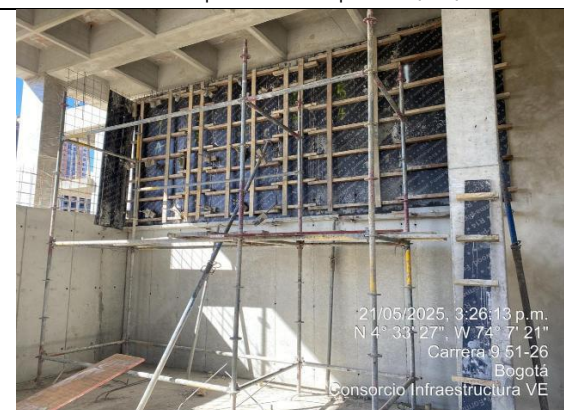
Fundida de muros salas de paso 21/05/2025