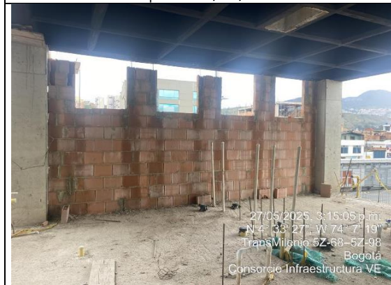
Instalación de muros 27/05/2025