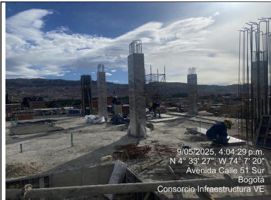
Fundida columnas 4 piso 9/05/2025