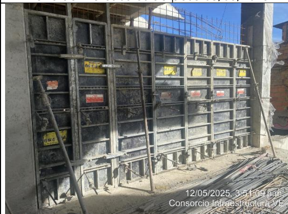
Fundida de muros salas de paso 12/05/2025