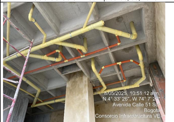
Instalación de redes hidráulicas 08/05/2025