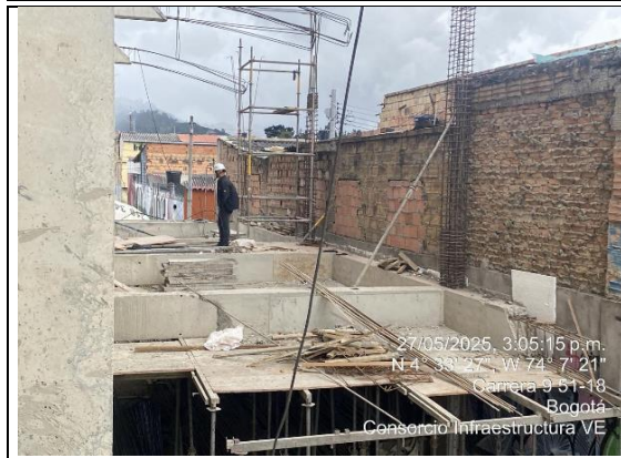
Armado de placa primer nivel acceso a salas de paso 27/05/2025