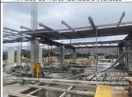
Armado de placa de cubierta 22/05/2025