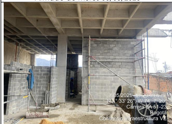
Instalación de mampostería 1 nivel 7/05/2025