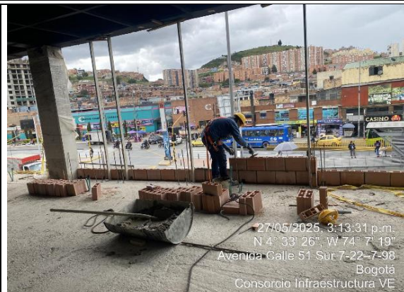
Instalación de muros de fachada 27/05/2025