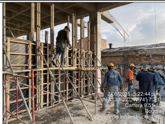
Fundida de muros salas de paso 02/05/2025