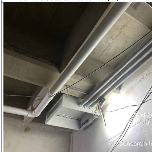
Instalación redes eléctricas 07/04/2025