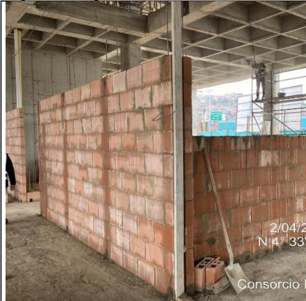
Construcción muros en mampostería 02/04/2025