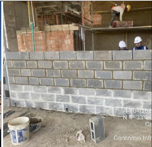
Armado de muros 14/04/2025