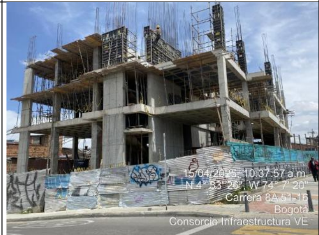
Vista General 15/04/2025