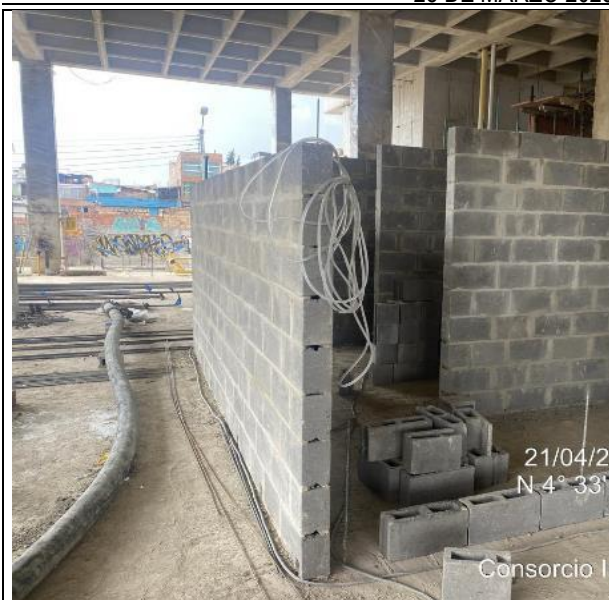
Armado de muros 22/04/2025