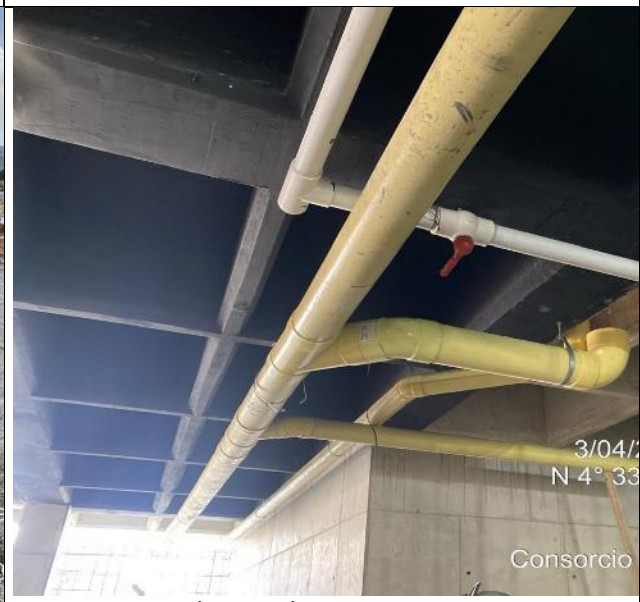
Instalación tubería sanitaria 03/04/2025