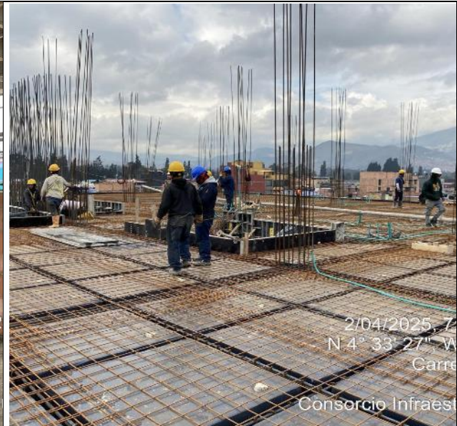
Armado de acero placa de tercer nivel 02/04/2025