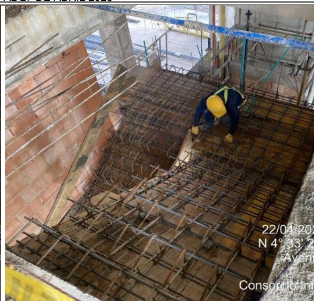
Armado de escalera 22/04/2025