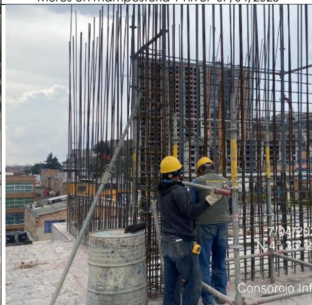
Armado de pantallas 3 nivel 07/04/2025