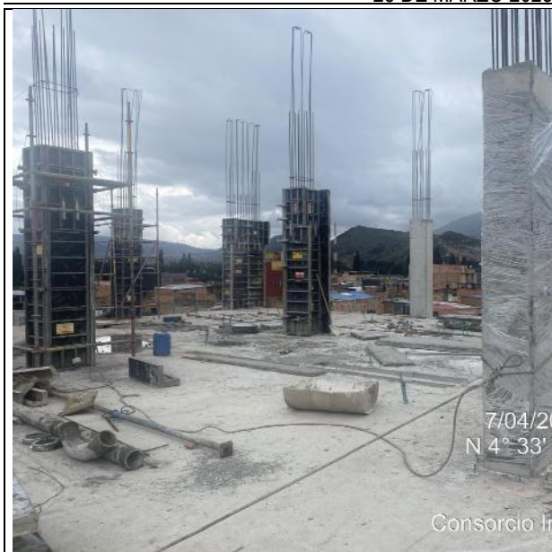
Fundida de columnas 3 nivel 7/04/2025