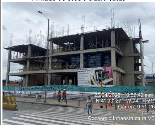
Vista General 25/04/2025