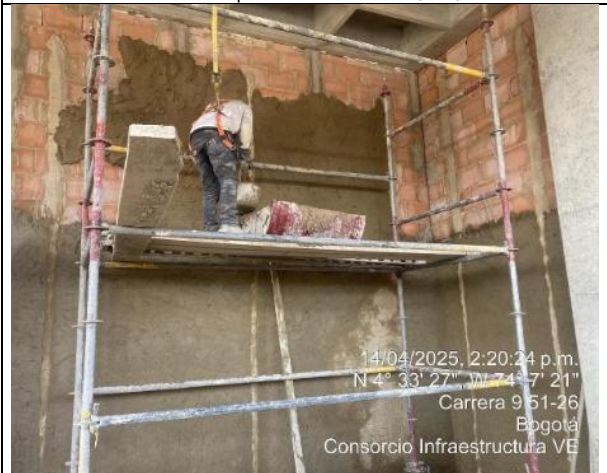
Pañete Muros 14/04/2025