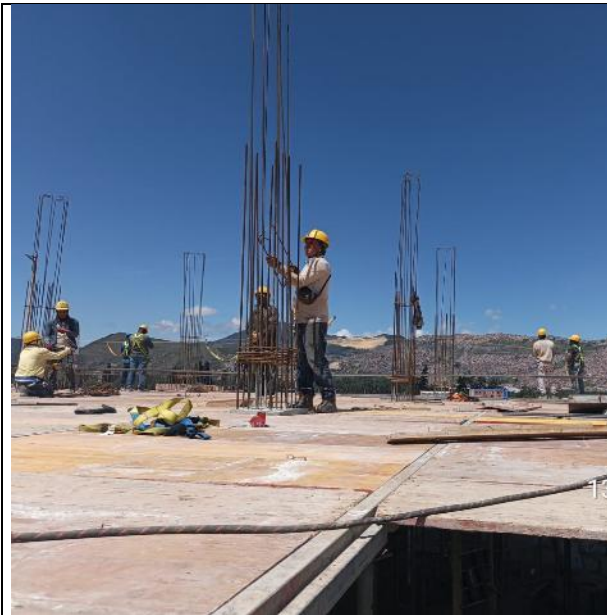
Armado de placa 4 nivel 13/04/2025