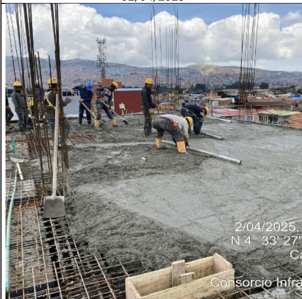
Fundida de placa 3 nivel 02/04/2025