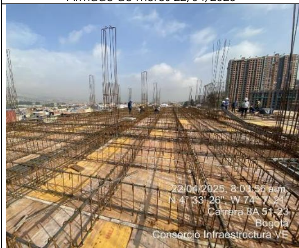
Armado de placa 4 nivel 22/04/2025