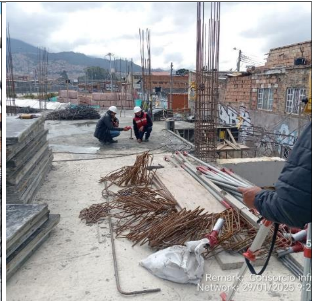
Control Topografico placa de N 0-005 29/01/2025