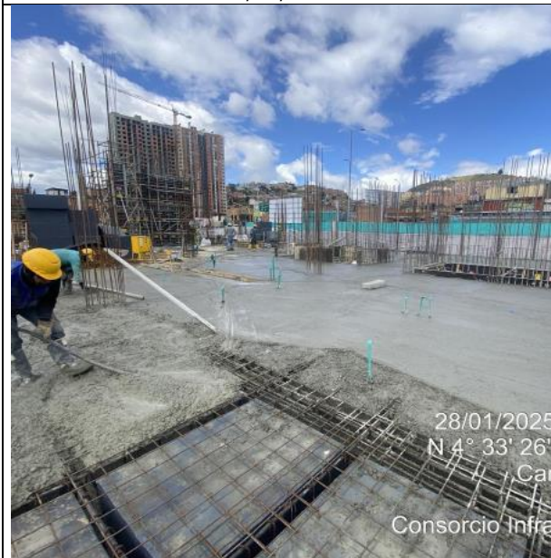
Fundida placa Nivel 0-005 28/01/2025