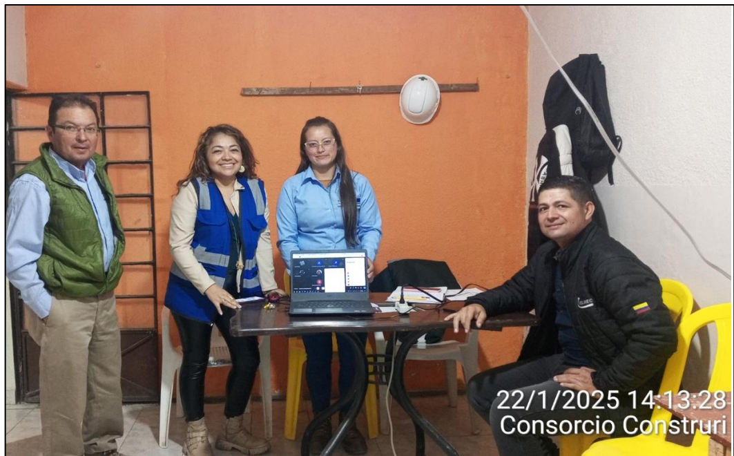
Equipo técnico y social contratista e interventoría