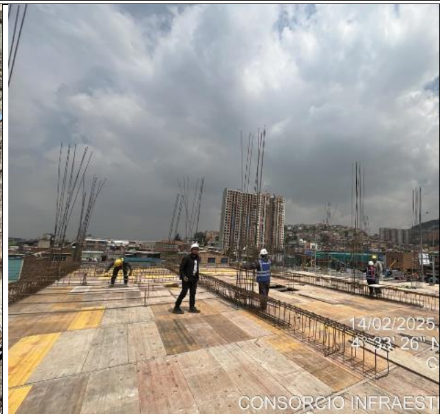
Armado de placa doble altura 14/02/2025