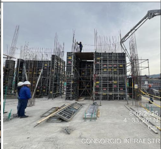
Fundida de pantallas 08/02/2025