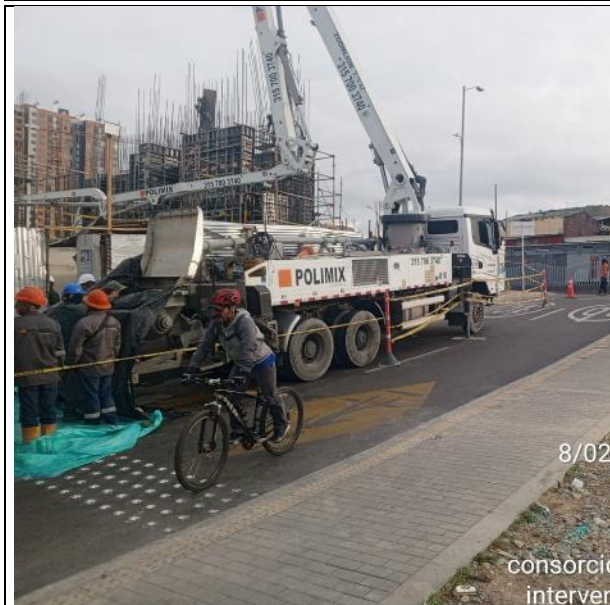
Fundida de pantallas 08/02/2025