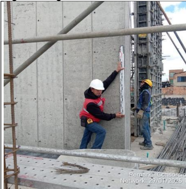
Armado muros pantalla primer piso 29/01/2025