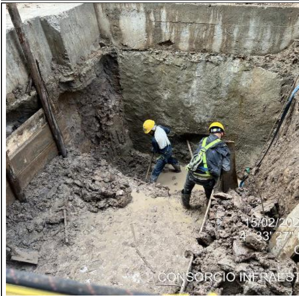
Excavación foso eyector 15/02/2025