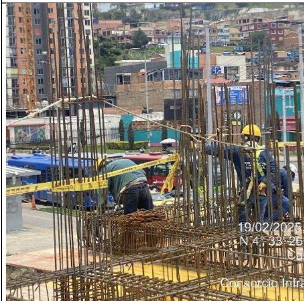
Armado de placa doble altura 19/02/2025