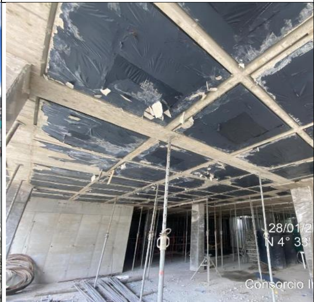
Desencofrado placa N 0-005 28/01/2025