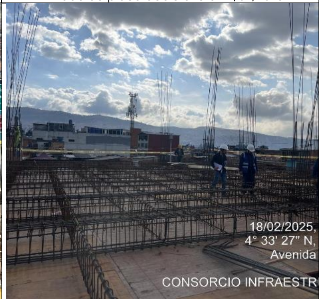
Armado de placa doble altura 18/02/2025