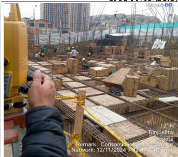
Verificación topográfica 12/11/2024