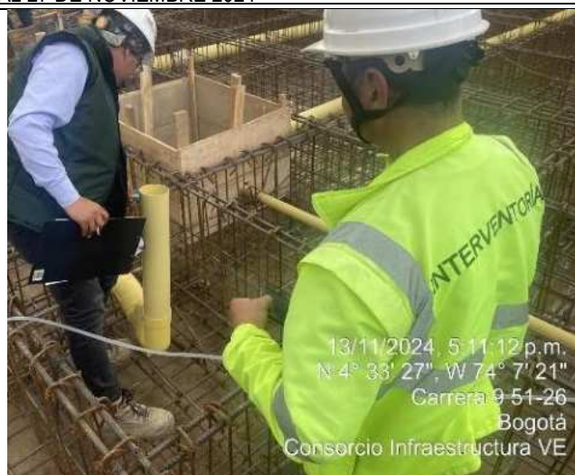
Armado de acero para cimentación 25/10/2024