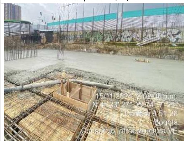
Fundida de placa 14/11/2024