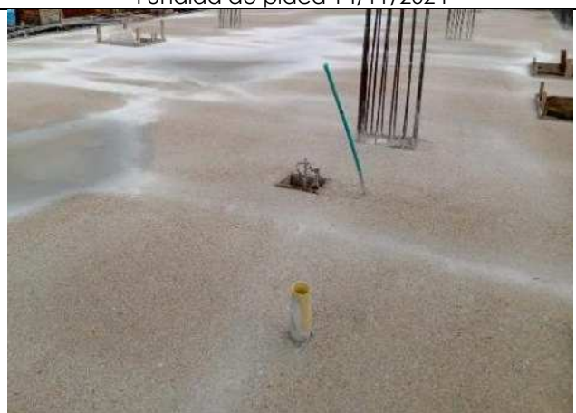
Fundida de placa 14/11/2024