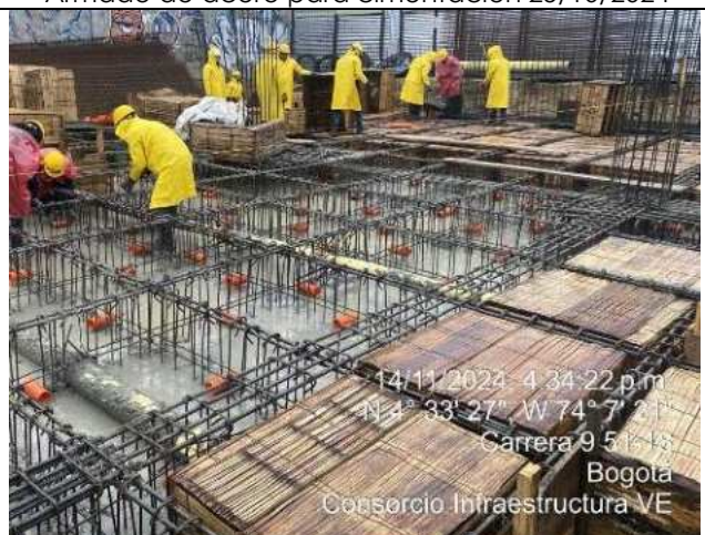
Fundida de placa 14/11/2024