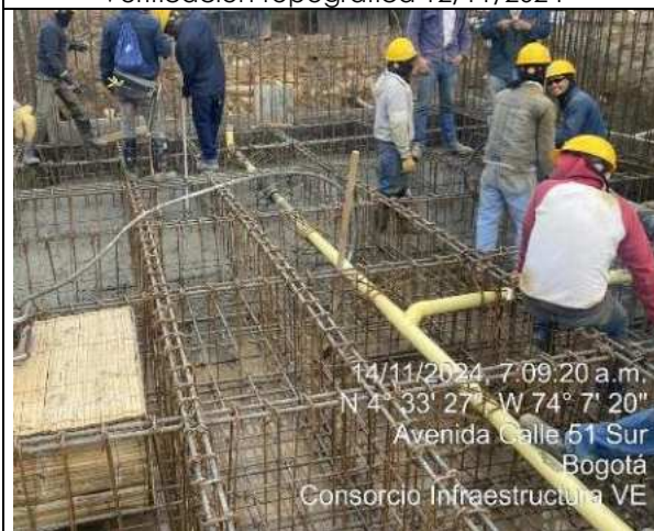
Fundida de placa 14/11/2024