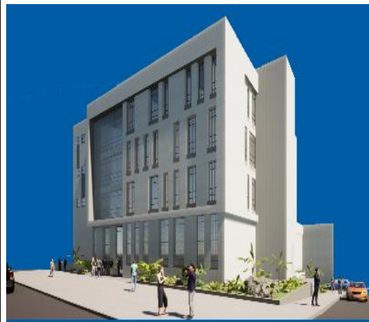
RENDER ACTUALIZADO 12/01/2024