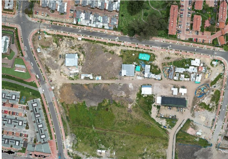
CL 173 7A 85 (USAQUEN) - 7319 M2