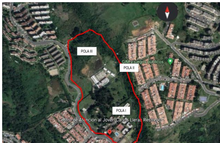
Vista Aérea del CAE CARLOS LLERAS RESTREPO, en la ciudad de Medellín – Antioquia.