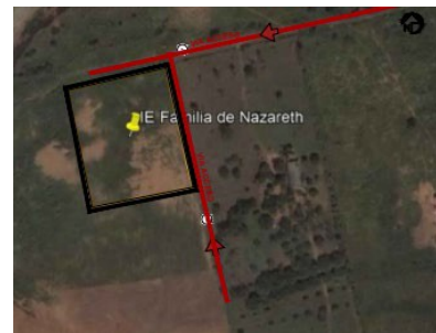
Localización del Colegio Familia de Nazareth en Riohacha

NOTA: CONOCIMIENTO DEL SITIO DEL PROYECTO: Será responsabilidad del proponente conocer las condiciones del sitio de ejecución del proyecto y actividades a ejecutar, para ello el proponente podrá hacer uso de los programas informáticos y las herramientas tecnológicas disponibles, teniendo como punto de referencia la ubicación del proyecto, calle 13B # 45-87 en Riohacha, La Guajira En consecuencia, correrá por cuenta y riesgo de los proponentes, inspeccionar y examinar los lugares donde se proyecta realizar los trabajos, actividades, obras, los sitios aledaños y su entorno e informarse acerca de la naturaleza del terreno, la forma, características, accesibilidad del sitio, disponibilidad de canteras o zonas de préstamo, así como la facilidad de suministro de materiales e insumos generales. De igual forma, la ubicación geográfica del sitio del proyecto, historial de comportamiento meteorológico de la zona y demás factores que pueden incidir en la correcta ejecución del proyecto.