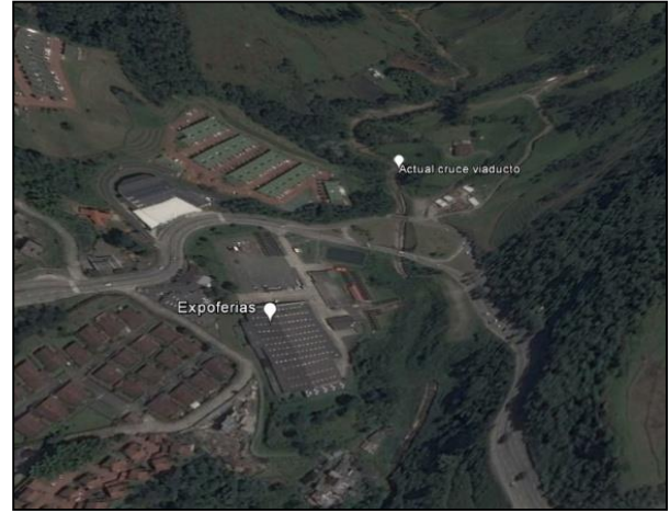
Figura 2 – Localización específica proyecto Paso Subfluvial El Perro – Manizales, Caldas

El proyecto se localiza en el Municipio de Manizales, Departamento de Caldas. Manizales está ubicada en el centro occidente de Colombia, sobre la Cordillera Central de los Andes, cerca del Nevado del Ruiz, y en el centro de las tres principales ciudades de Colombia, en el llamado triángulo de oro. La distancia entre Manizales y Bogotá es de 303 km. Entre Manizales y Medellín hay 194 km, y entre Manizales y Cali hay 263 Km. Está comunicada con las capitales vecinas de Pereira y Armenia a través de la Autopista del Café.