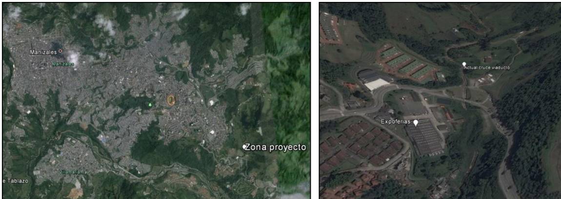
Figura 2 – Localización específica proyecto Paso Subfluvial El Perro – Manizales, Caldas

El proyecto se localiza en el Municipio de Manizales, Departamento de Caldas. Manizales está ubicada en el centro occidente de Colombia, sobre la Cordillera Central de los Andes, cerca del Nevado del Ruiz, y en el centro de las tres principales ciudades de Colombia, en el llamado triángulo de oro. La distancia entre Manizales y Bogotá es de 303 km. Entre Manizales y Medellín hay 194 km, y entre Manizales y Cali hay 263 Km. Está comunicada con las capitales vecinas de Pereira y Armenia a través de la Autopista del Café.