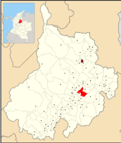
Figura 1 – Localización General Municipio de San Gil – Santander