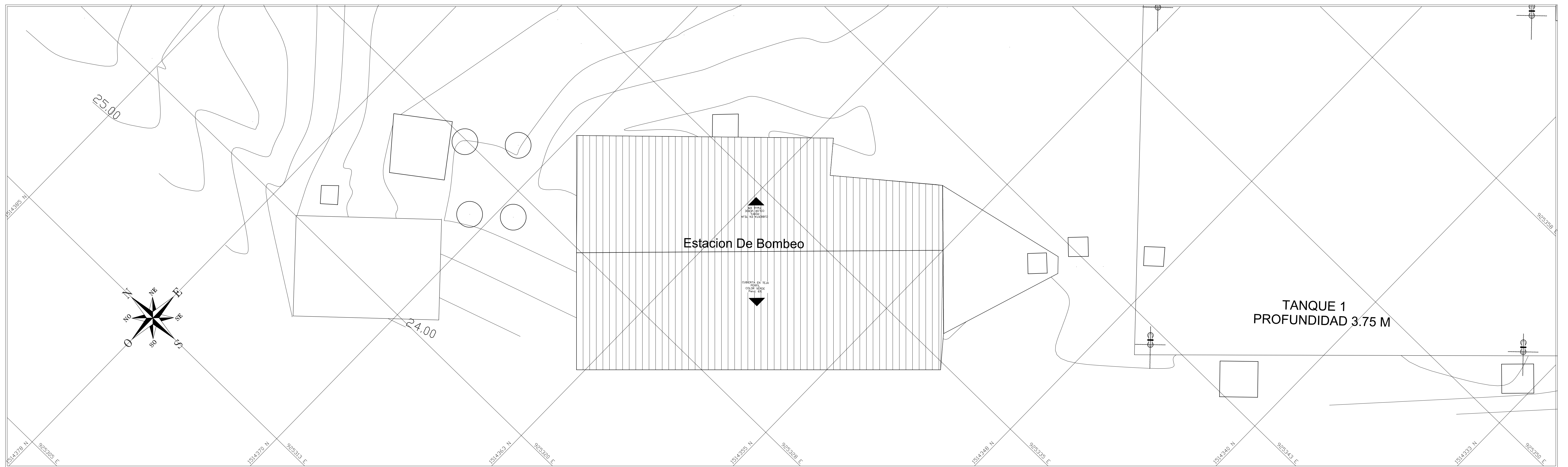
LOCALIZACIÓN ESCALA 1:75