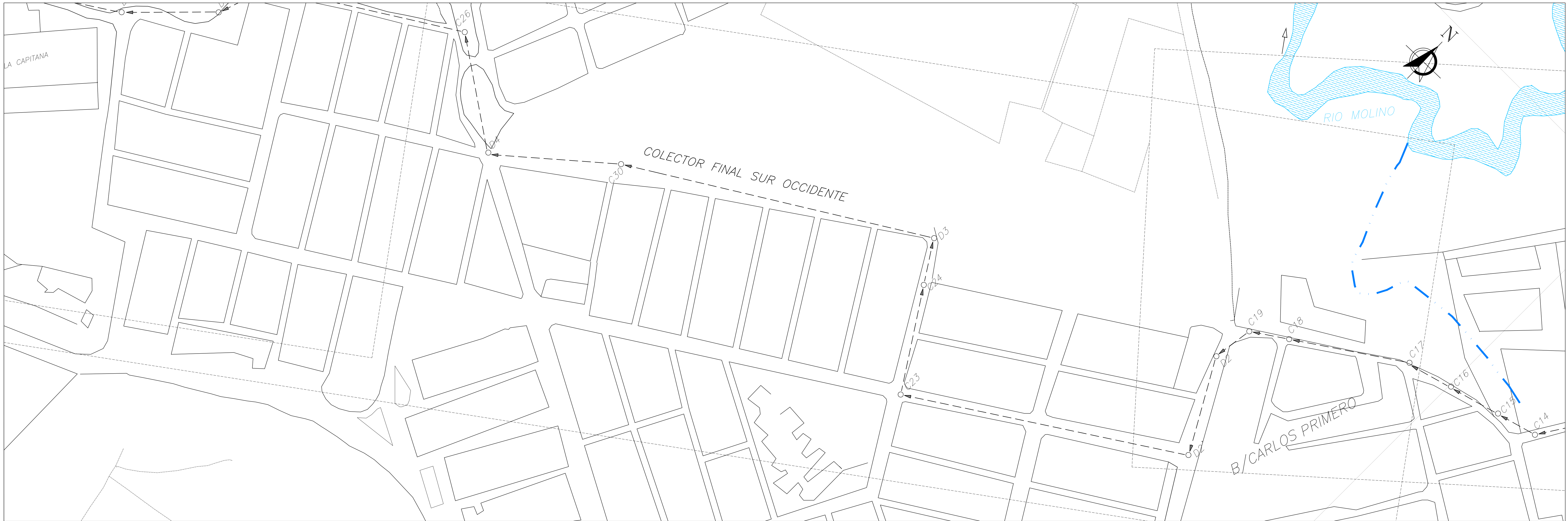
PLANTA GENERAL ESCALA 1:1000