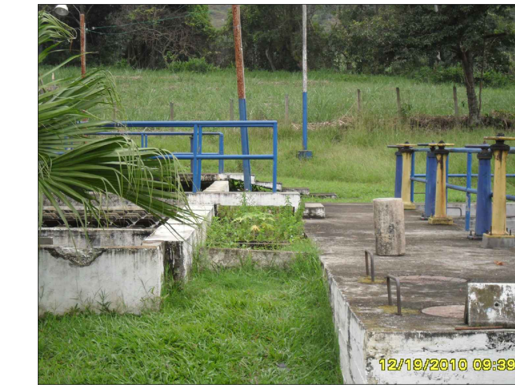
PASARELA FLOCULADOR HIDRAULICO FILTROS