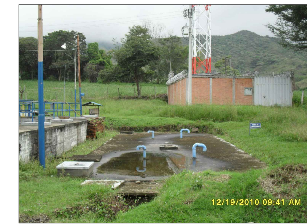
TANQUE ALMACENAMIENTO CHIQUILINES