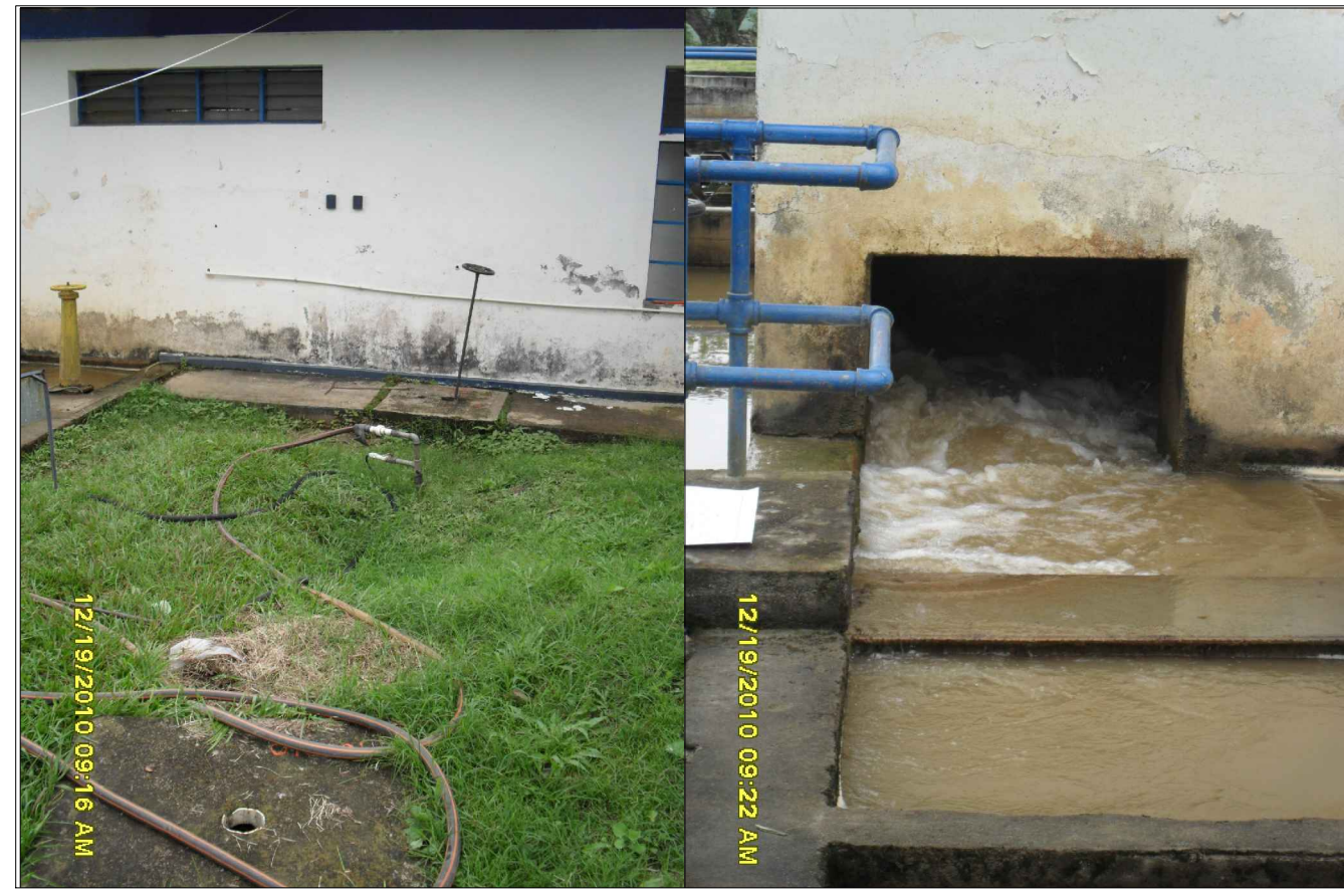
VIENE DE LA CAPTACION