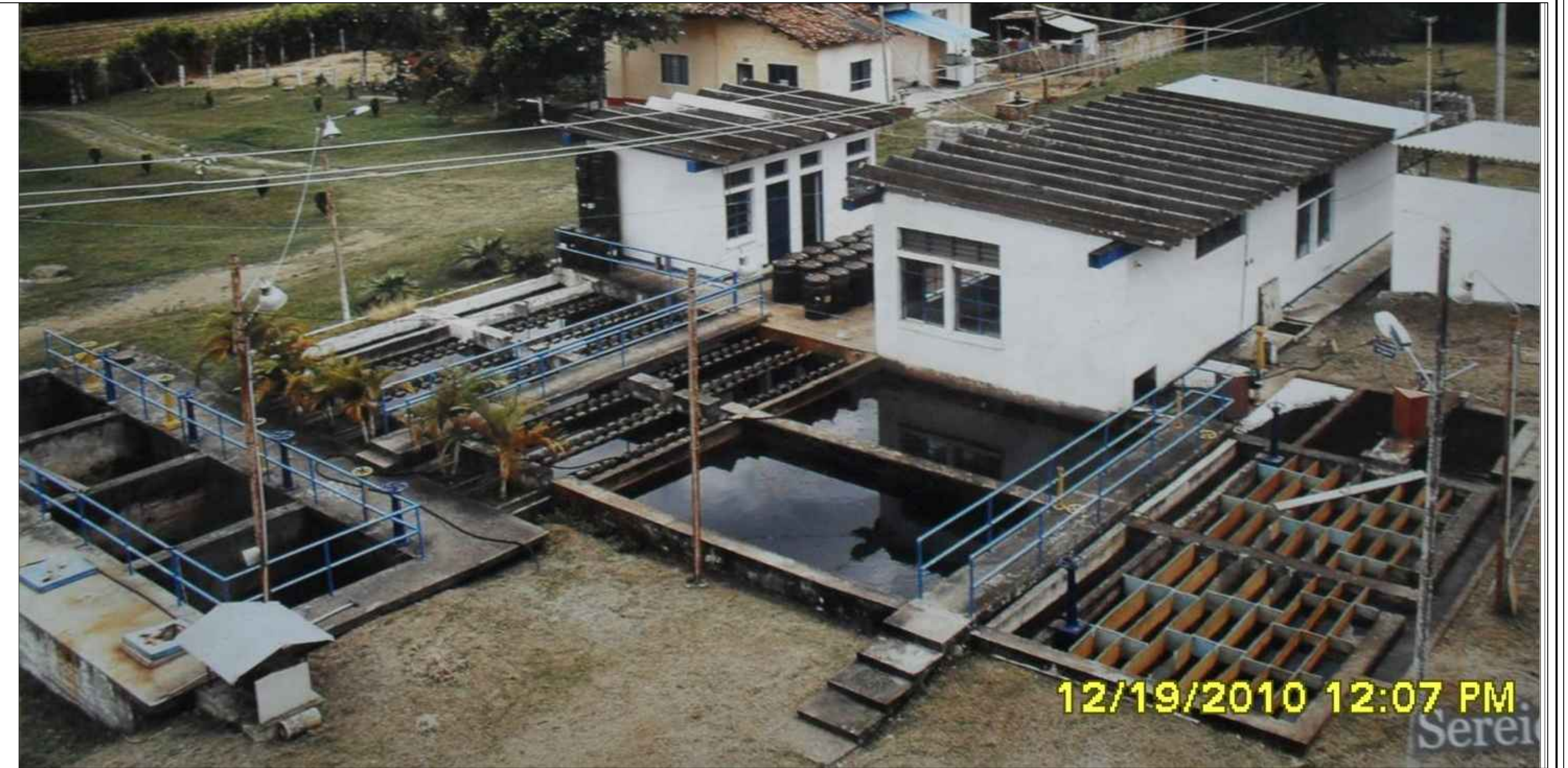
12/19/2010 12:07 PM