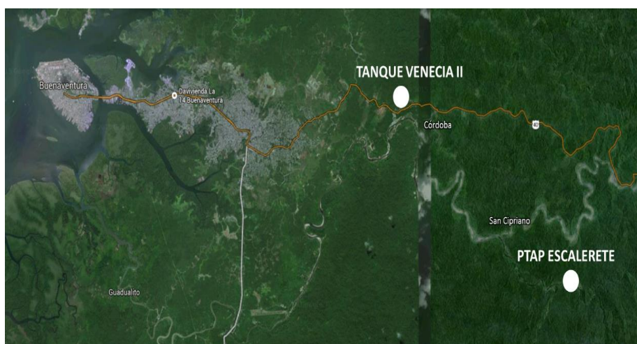
Figura No. 1 – Localización Tanque Venecia II y PTAP Escalerete

El tanque de almacenamiento estará ubicado al nororiente del municipio sobre la vía Buenaventura dentro del predio actual de la planta de tratamiento de agua potable Venecia, que queda ubicada en la vía Loboguerrero-Buenaventura a la altura del corregimiento de Córdoba, como se puede apreciar en la Figura No. 1.