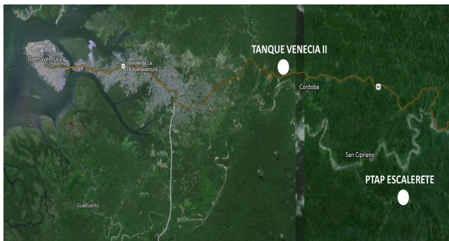
Figura No. 1 – Localización Tanque Venecia II y PTAP Escalerete

Adicionalmente el seguimiento y control al mismo por parte de LA CONTRATANTE y/o el Supervisor delegado será realizado en la ciudad de Bogotá.