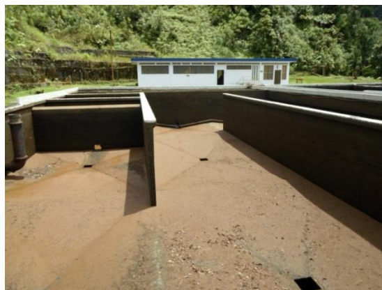
Ilustración No. 3 - Sedimentador convencional Línea 2 PTAP Escalerete

Seguido al floculador, el agua ingresa por medio una pantalla perfora al sedimentador convencional, el cual tiene dos muros en el centro que permiten de alguna manera flujo pistón y aumentan el tiempo de retención hidráulico. No obstante, sin el correcto funcionamiento de los procesos previos de coagulación y floculación, la sedimentación no funciona sin importar si cumple con todos los parámetros hidráulicos recomendados, ya que al no existir formación de floc, las partículas coloidales (generadoras de turbiedad) no alcanzan a sedimentar.