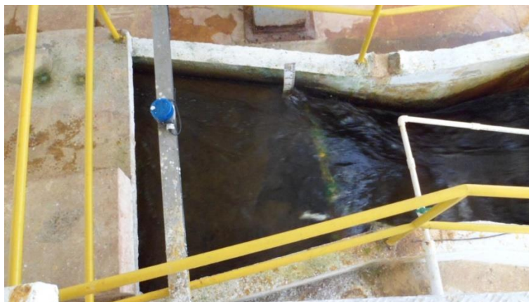
Ilustración No. 1 - Mezcla rápida (PTAP Escalerete)

Según el informe de diseño de la optimización de la PTAP Escalerete realizado por IEH GRUCON: La planta de tratamiento de agua potable de Escalerete tiene una capacidad de 450 L/s a 480 L/s. El agua sale de la cámara de repartición de caudales e ingresa a un canal de entrada donde se realiza la mezcla rápida por medio de una canaleta Parshall.