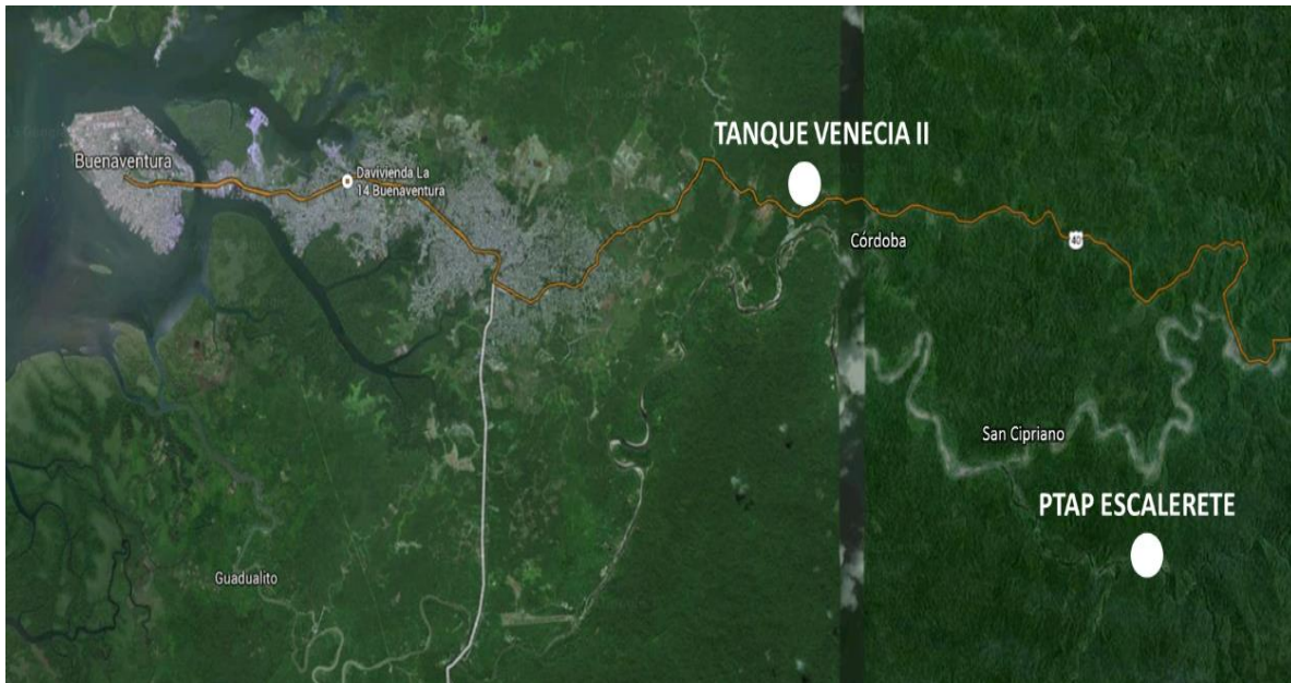
Figura No. 1 – Localización Tanque Venecia II y PTAP Escalerete

El tanque de almacenamiento estará ubicado al nororiente del municipio sobre la vía Buenaventura dentro del predio actual de la planta de tratamiento de agua potable Venecia, que queda ubicada en la vía Loboguerrero-Buenaventura a la altura del corregimiento de Córdoba, como se puede apreciar en la Figura No. 1.