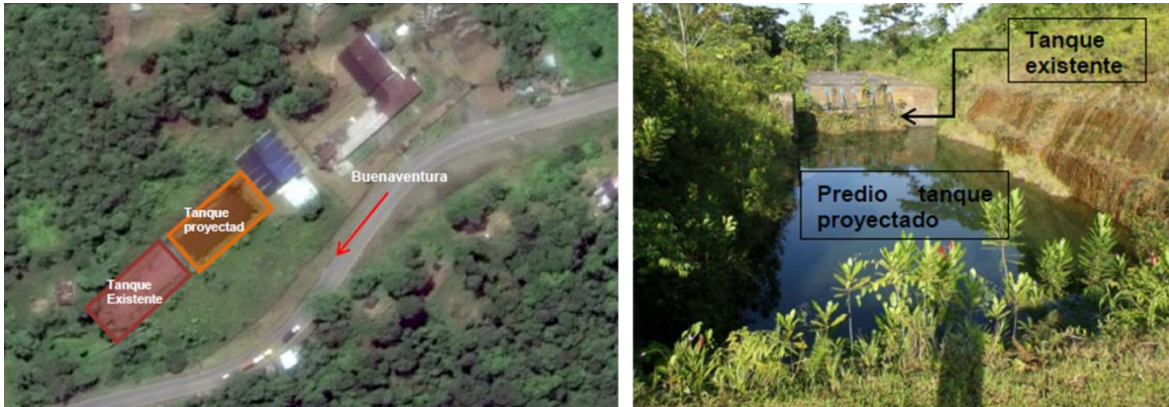
Ilustración No. 5 – Vista general tanque existente y localización tanque proyectado (PTAP Venecia)

Según el informe de diseño del tanque Venecia II realizado por IEH GRUCON: La PTAP de Venecia cuenta con un tanque de almacenamiento de 3840m 3 , el cual es alimentado desde la PTAP de Escalerete. La construcción del nuevo tanque se planteó aledaño al existente como se observa en la ilustración No. 5.