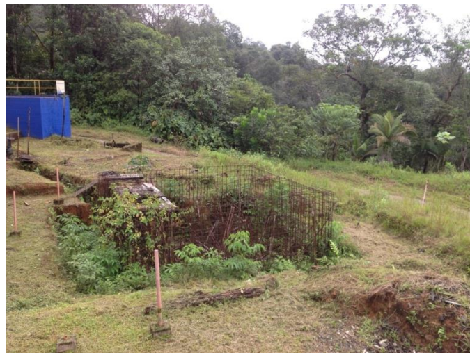
Ilustración No. 4 - Tanque de contacto abandonado

Finalmente, para el proceso de desinfección se utiliza cloro gaseoso con cilindros de 68 kg, no se utilizan cilindros de una tonelada debido a las dificultades de transporte. El cloro es agregado en el canal de agua filtrada y de ahí sale directamente hacia la conducción. Dentro de las obras que se comenzaron para la optimización entre los años 2006 a 2007, se inició la construcción de un tanque de contacto de cloro que no fue terminado, únicamente se alcanzaron a instalar algunos aceros y a construir la placa de fondo (ver Ilustración No. 4).