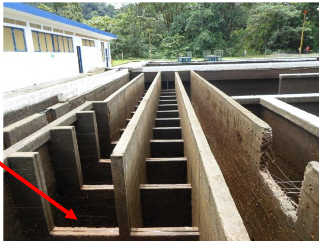
Ilustración No. 2 - Floculador de pantallas línea de PTAP Escalerete

Seguido al floculador, el agua ingresa por medio una pantalla perfora al sedimentador convencional, el cual tiene dos muros en el centro que permiten de alguna manera flujo pistón y aumentan el tiempo de retención hidráulico. No obstante, sin el correcto funcionamiento de los procesos previos de coagulación y floculación, la sedimentación no funciona sin importar si cumple con todos los parámetros hidráulicos recomendados, ya que al no existir formación de floc, las partículas coloidales (generadoras de turbiedad) no alcanzan a sedimentar.