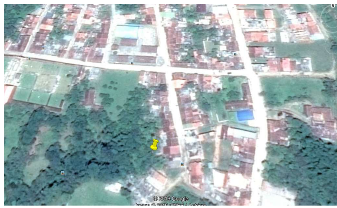
Croquis del Predio