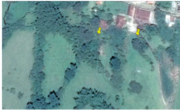
Croquis del Predio