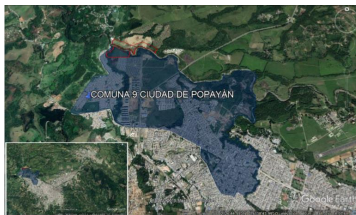
Figura 2 – área de influencia del proyecto

Para el predio lote 2, y de acuerdo con lo establecido por la secretaria de planeación del municipio de Popayán, con radicado No 20201900004301 del 13/01/2020, el inmueble en mención; forma parte del Plan Parcial Hacienda Chune -Plan de Ordenamiento Territorial- POT de Popayán, su uso está definido como como zona de protección y amortiguación entre las estructuras de tratamiento y las zonas de influencia de los barrios contiguos, tales como; Valle del Ortigal, Shama, Tequendama y Lomas de Granda, entre otros y permitirá la conexión el colector Pubus.