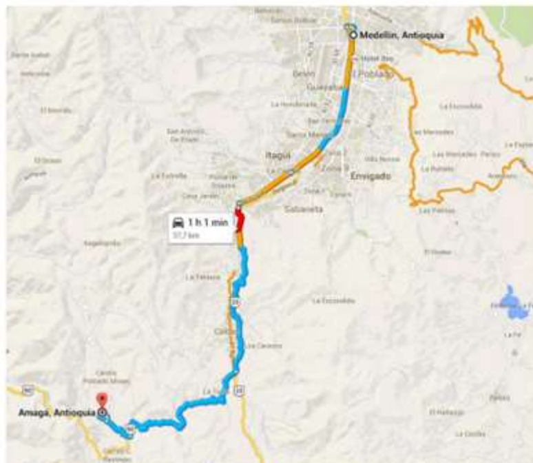
Figura 1 – Localización General Municipios Amagá Departamento de Antioquia

El Municipio de Amagá está situado en la subregión Suroeste del departamento de Antioquia. Limita al norte con el municipio de Angelópolis, al sur con los municipios de Fredonia y Venecia, al oriente con el municipio de Caldas y al occidente con el municipio de Titiribí. Su cabecera municipal está a 36 km y una hora en vehículo de la ciudad de Medellín.