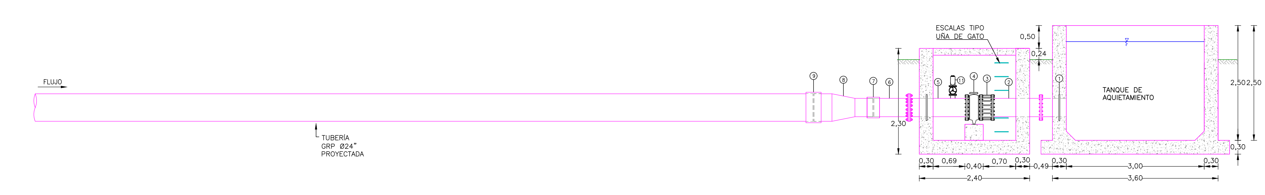
SECCIÓN A-A VÁLVULA DE LLEGADA PTAP ESCALA 1:50