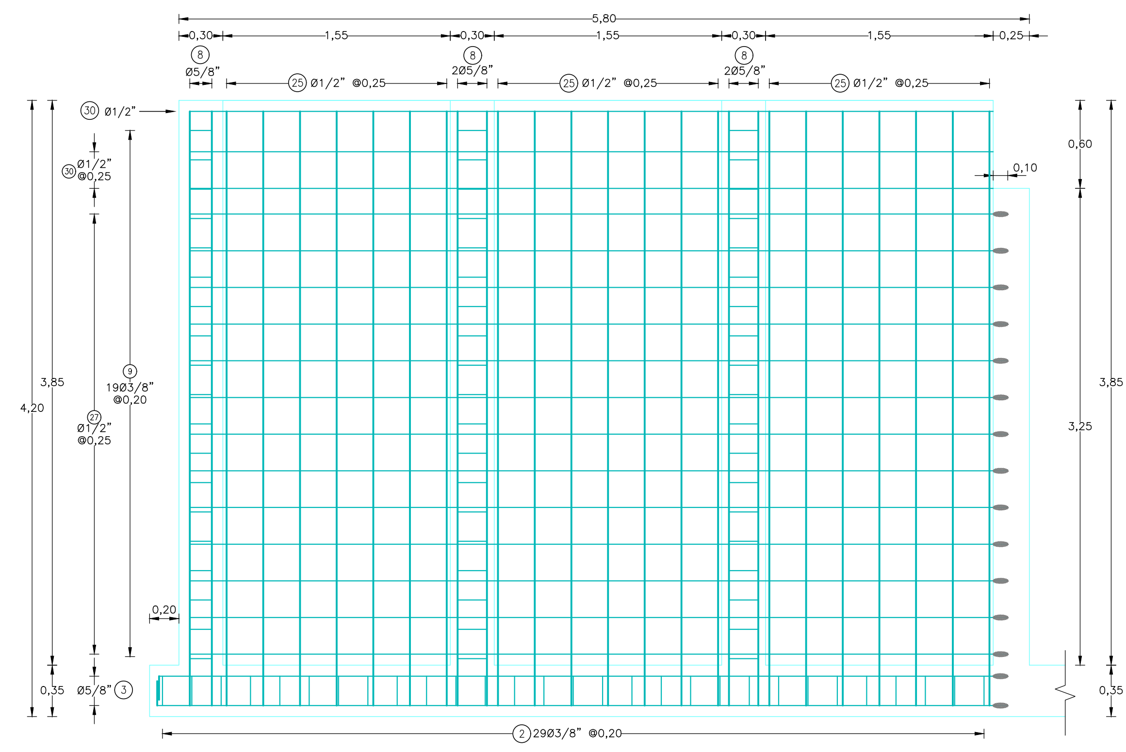
MURO G CARA INTERIOR ESCALA 1:25