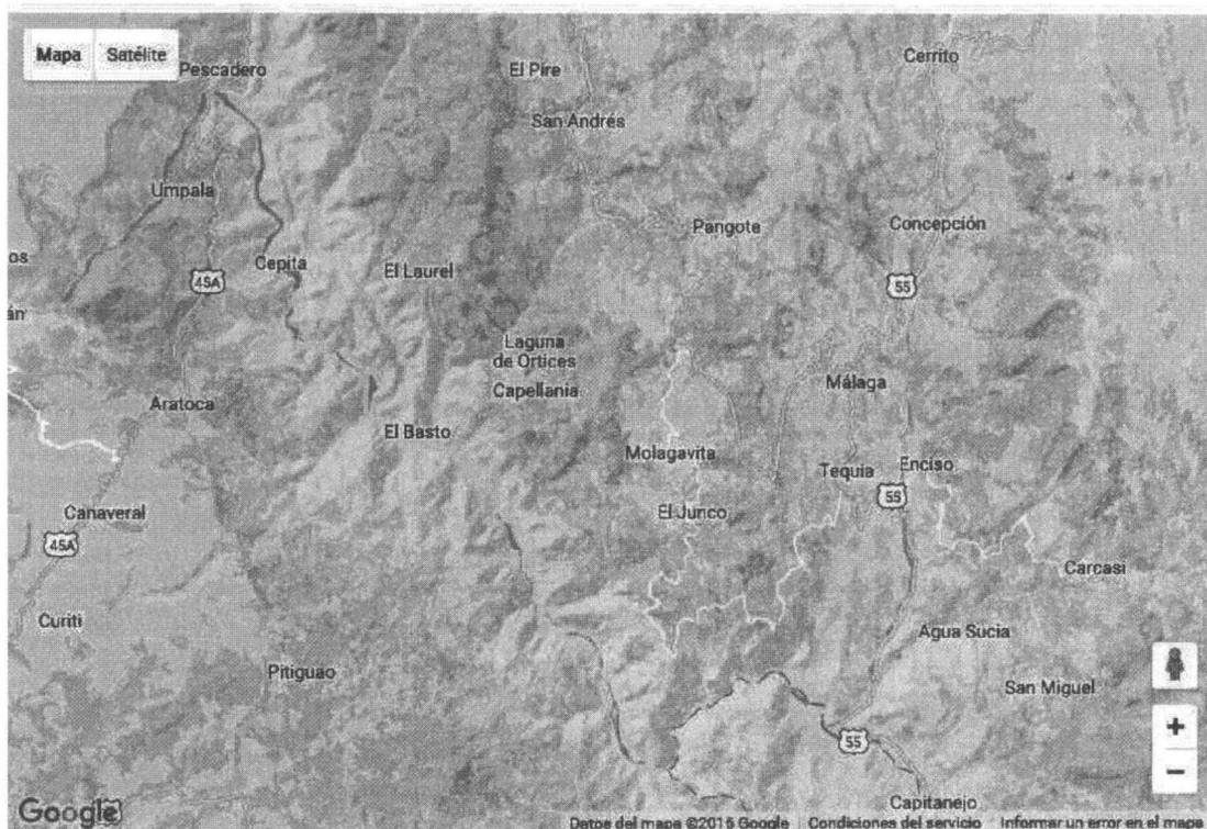
Figura 1 – Localización General del Proyecto

Molagavita, limita por el norte con el municipio de San Andrés; por el este con los municipios de Málaga y San José de Miranda; por el sur con el municipio de Covarachia (Boyacá) y por el oeste con los municipios de San Joaquín, Onzaga, Mogotes y Curiti.