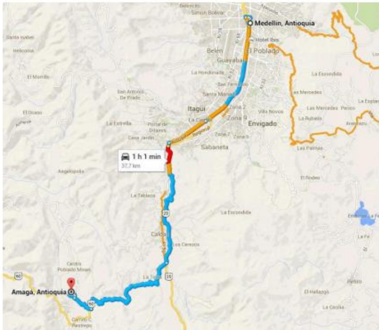
Figura 1 – Localización General Municipios Amagá Departamento de Antioquia