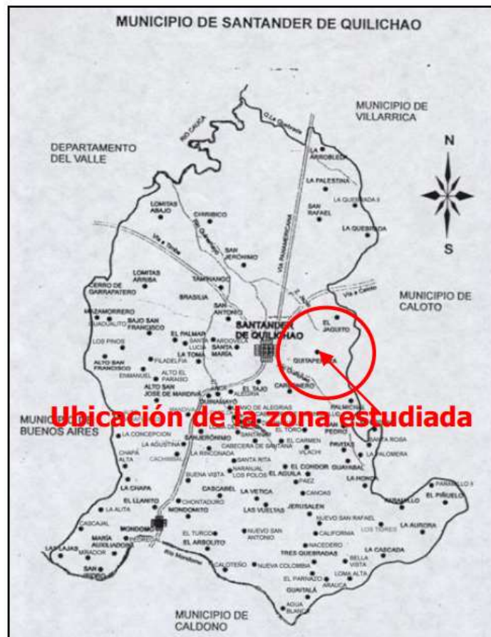
Figura 1: Ubicación Municipio Santander de Quilichao y zona de intervención. Tomado del estudio de suelos planta de tratamiento de agua potable Quitapereza municipio de Santander de Quilichao - Cauca

Santander de Quilichao se encuentra ubicado en la zona Norte del Departamento del Cauca en las coordenadas 3° 0' 38" Latitud Norte y 2° 23' 30" latitud Oeste y su altura sobre el nivel del mar es de 1.071 metros, a 97 Km al Norte de Popayán y a 45 Km al Sur de Santiago de Cali, Valle del Cauca, limitado al Norte con los Municipios de Villarrica y Jamundí, al Occidente con el Municipio de Buenos Aires, al Oriente con los Municipios de Caloto y Jambaló y al Sur con el Municipio de Calono.