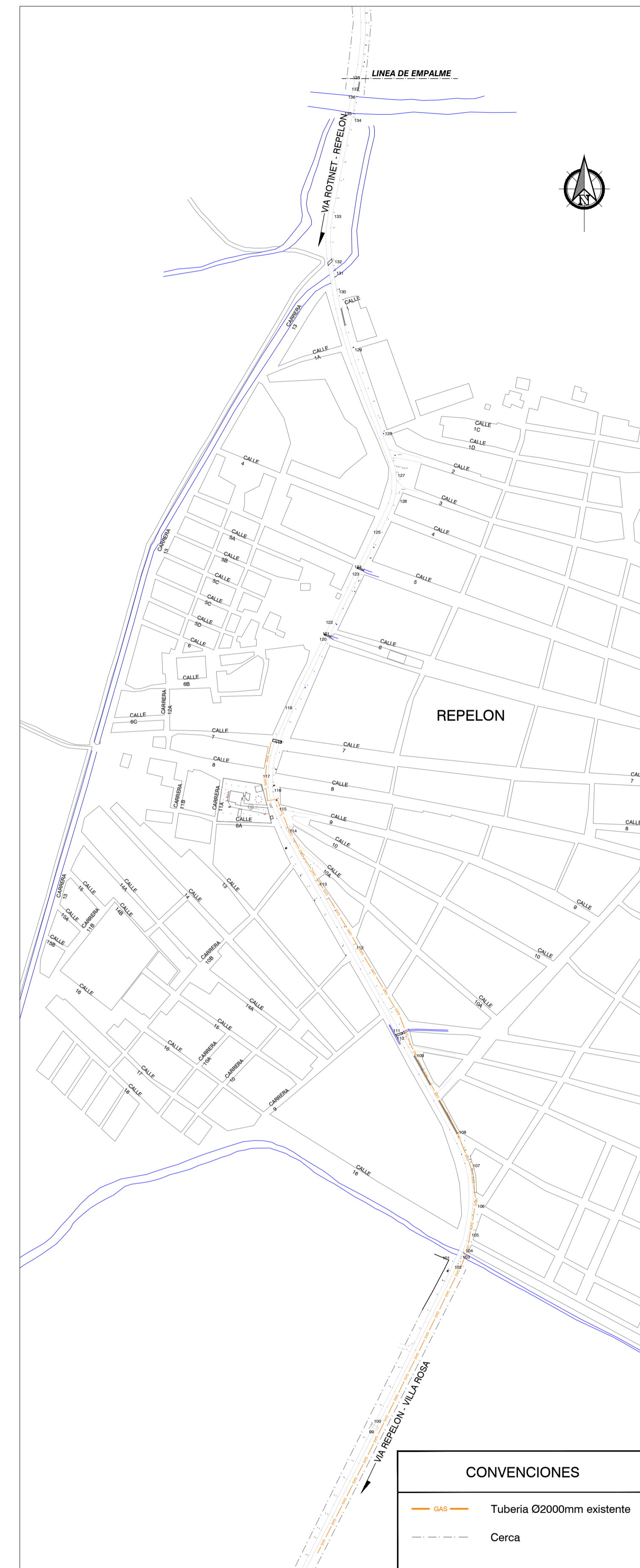
PLANTA UBICACION TUBERIA DE GAS EXISTENTE ESCALA: 1:5000