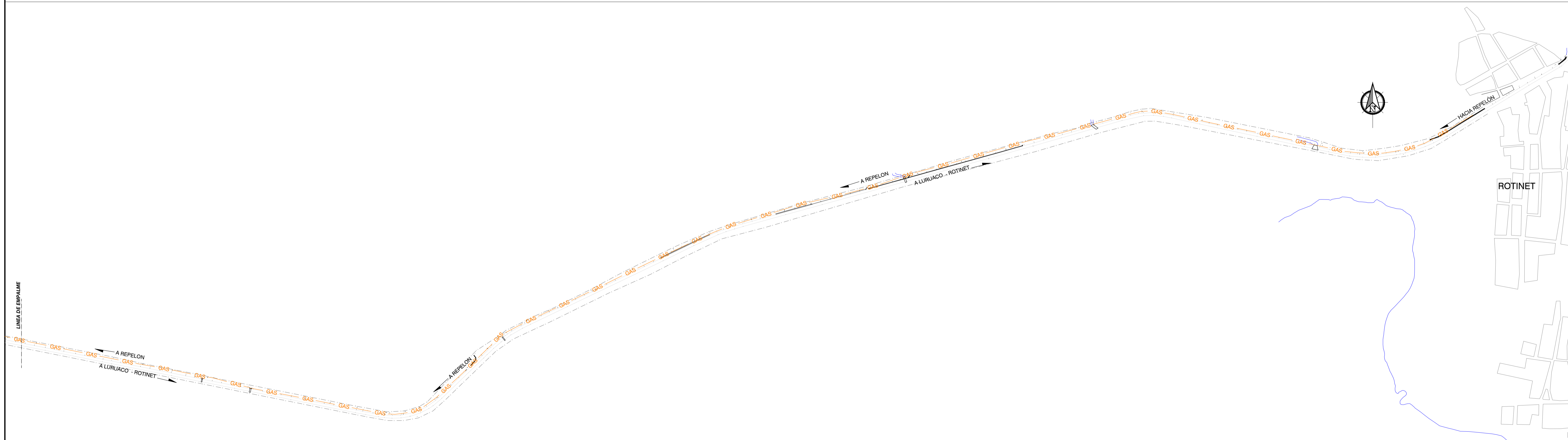
PLANTA UBICACION TUBERIA DE GAS EXISTENTE ESCALA: 1:5000