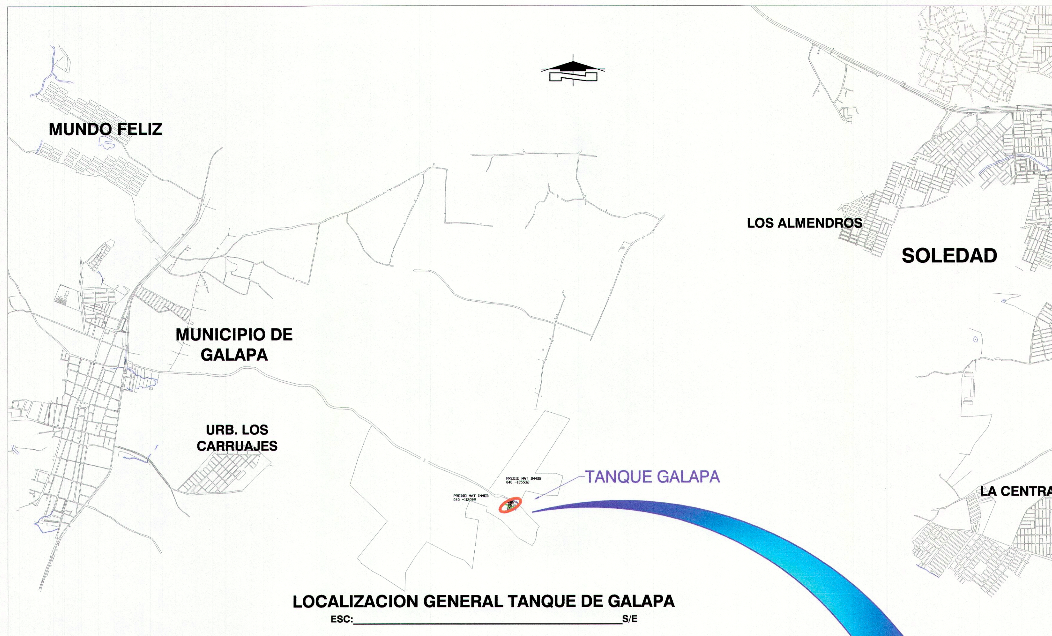
LOCALIZACION GENERAL TANQUE DE GALAPA ESC: _____ S/E