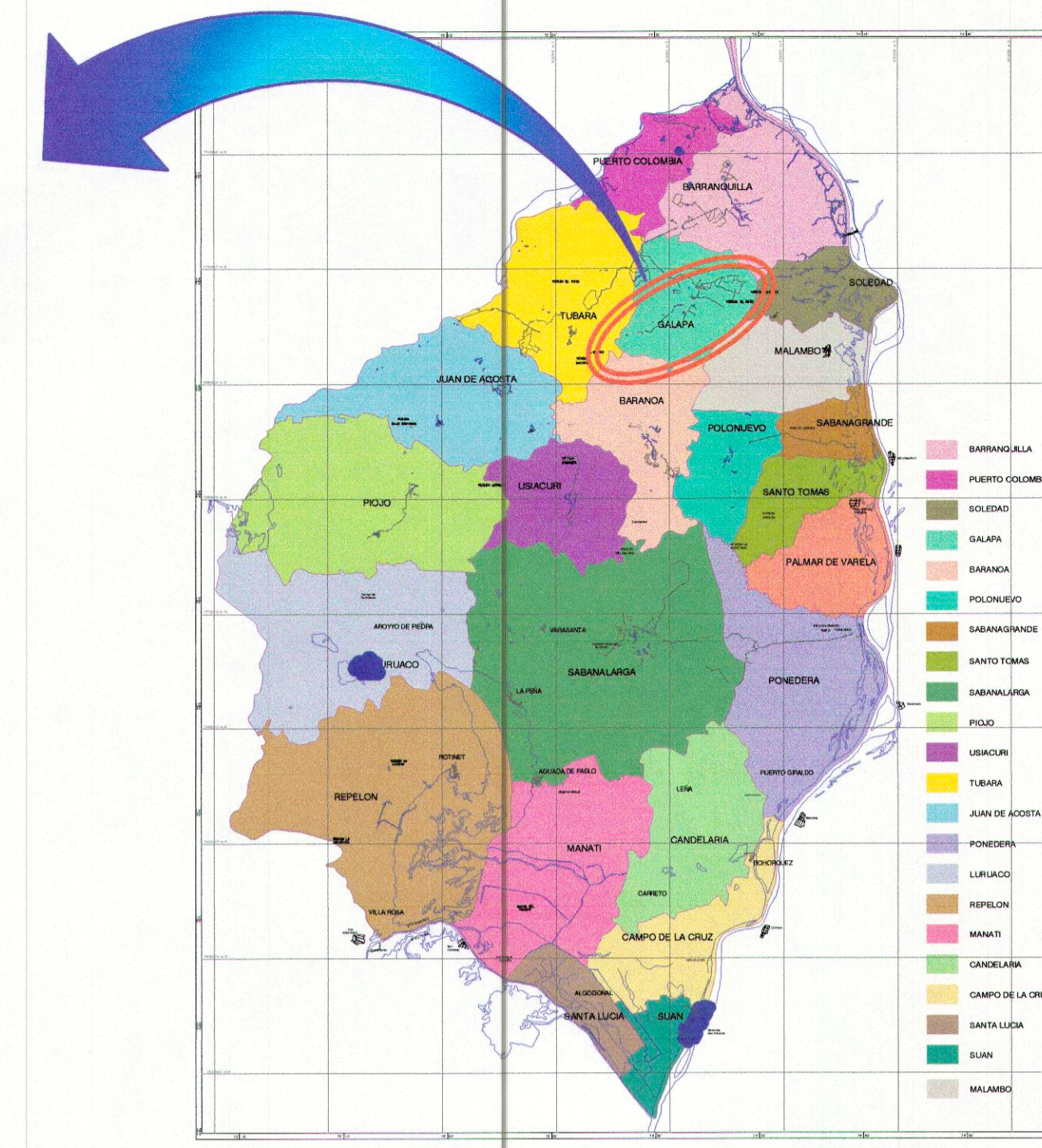
MAPA POLÍTICO DEPARTAMENTO DEL ATLÁNTICO LOCALIZACIÓN MUNICIPIO DE GALAPA ESC: _____ S/E