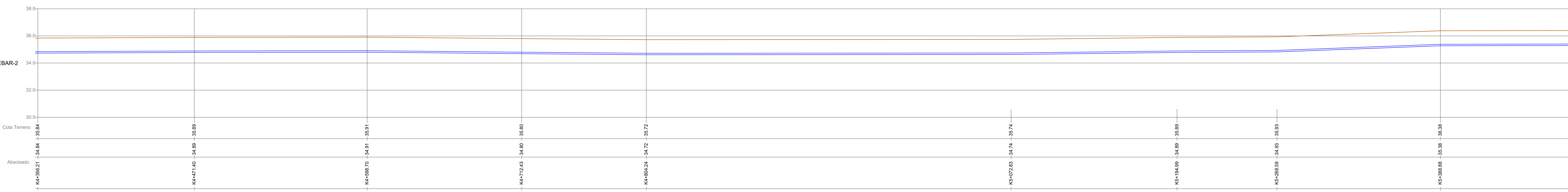
PERFIL LONGITUDINAL LÍNEA DE CONDUCCIÓN Escala 1:125