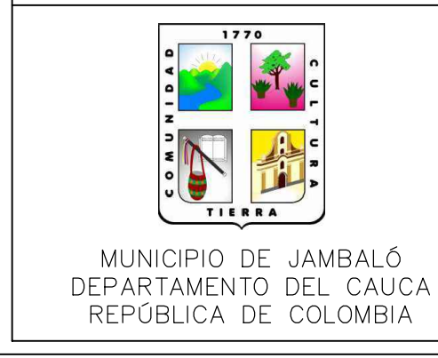
PLANTA GENERAL MUNICIPIO JAMBALÓ ESC: 1:2000

FROM INGENIEROS Consultoría y Construcción Consultor: FROM INGENIEROS S.A.S. NIT 9006545161