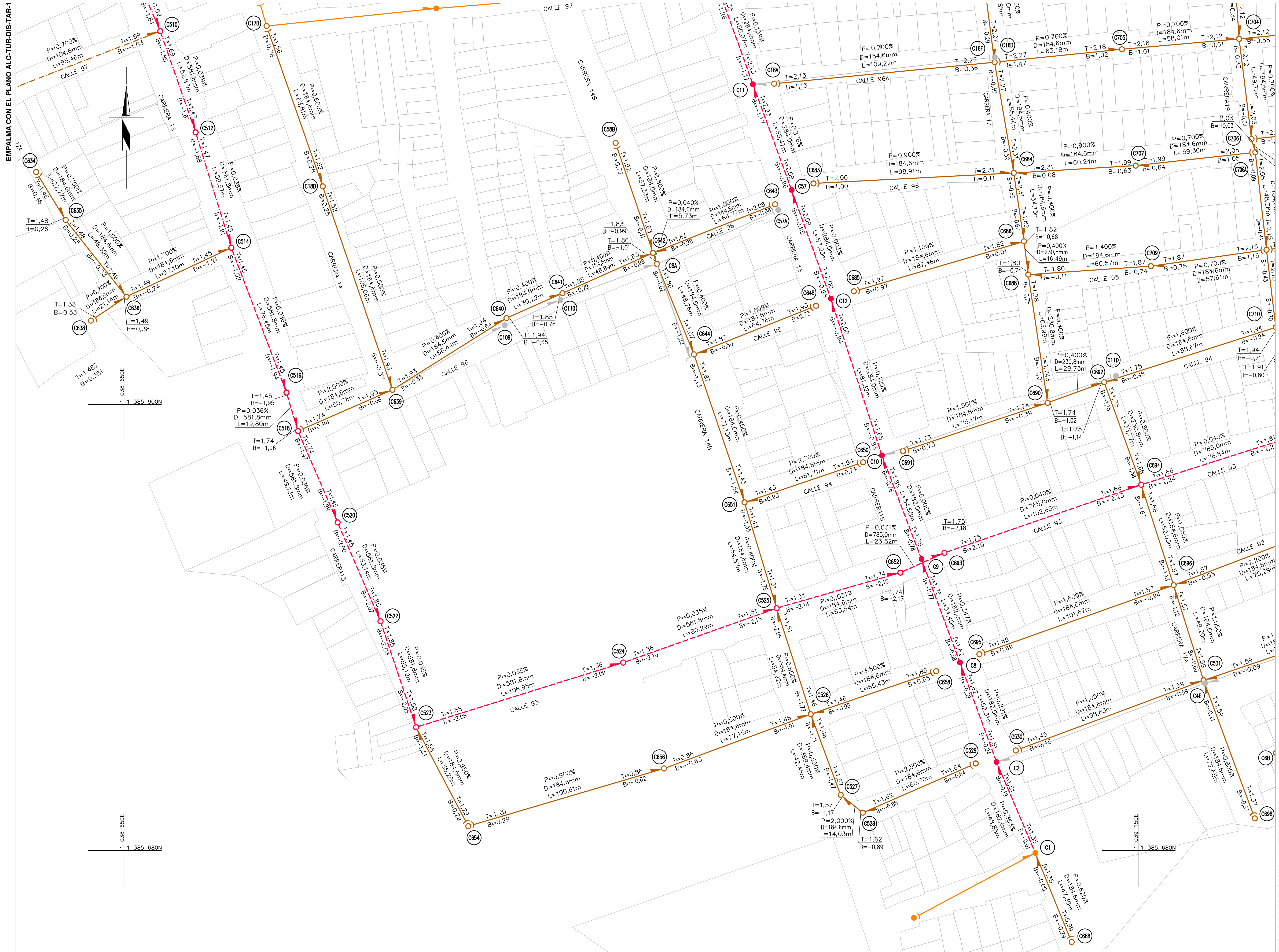
PLANTA ESCALA 1:1000