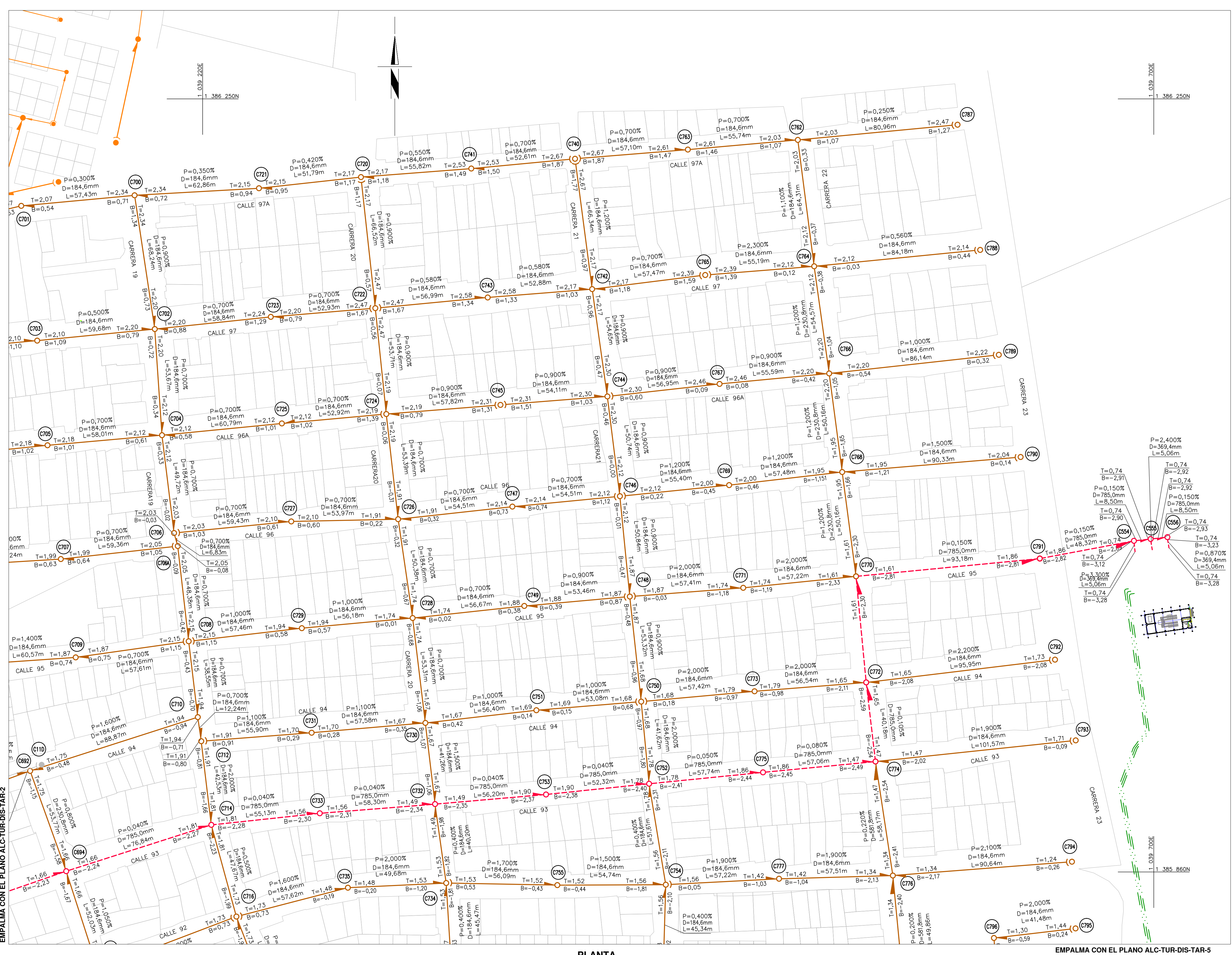
PLANTA ESCALA 1:1000