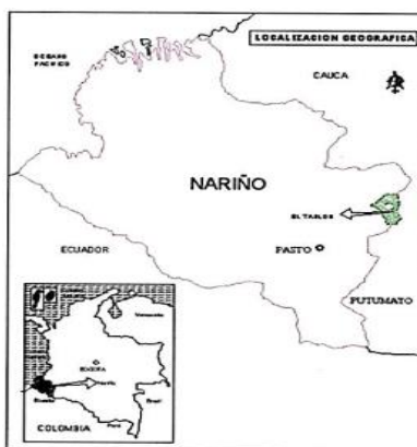
Mapa 1. Ubicación del Municipio de Tablón de Gómez

El municipio de Tablón se encuentra ubicado geográficamente en las coordenadas: