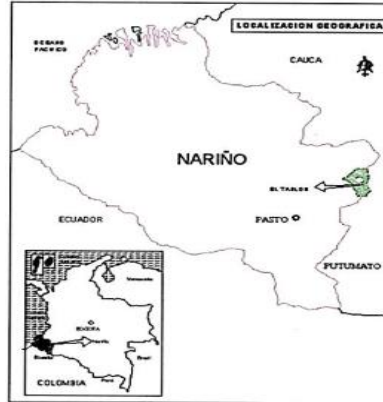
Mapa 1. Ubicación del Municipio de Tablón de Gómez

El municipio de Tablón se encuentra ubicado geográficamente en las coordenadas: