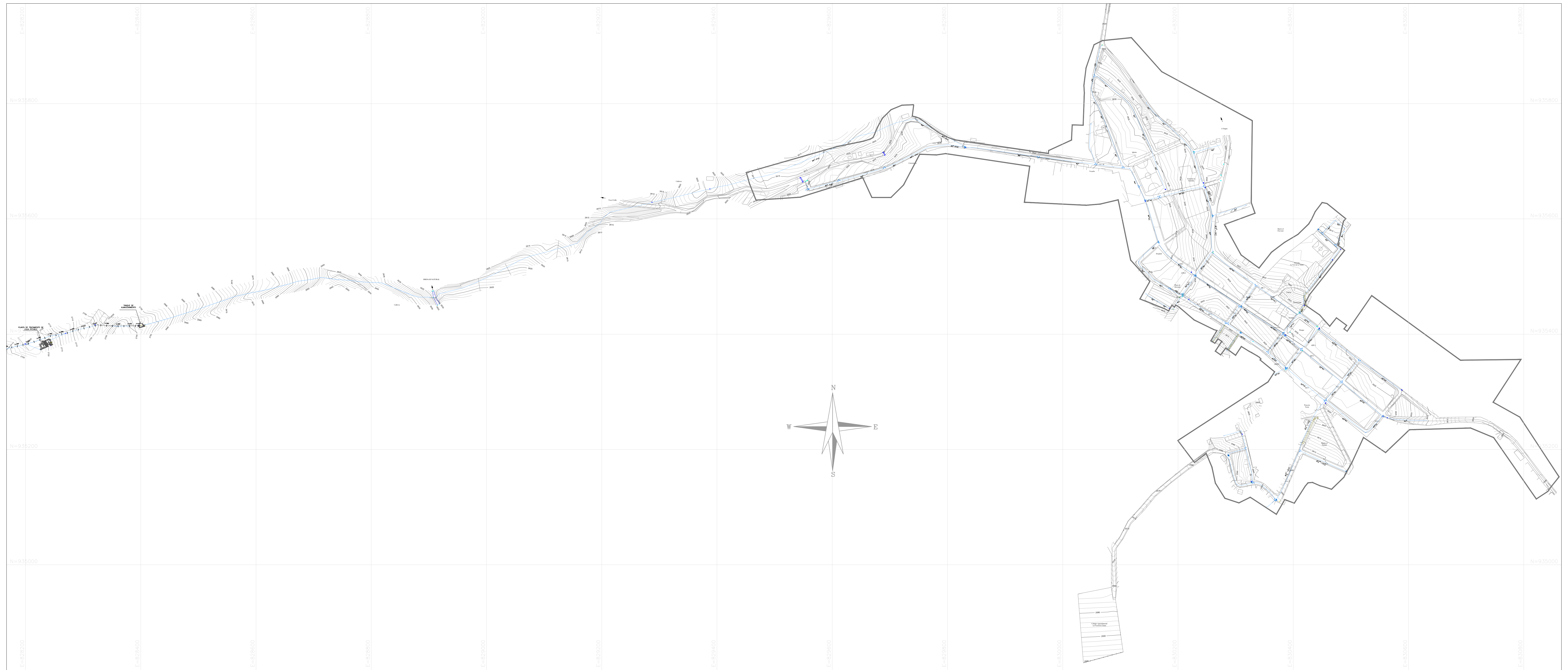
PLANO GENERAL REDES DE DISTRIBUCIÓN ESC 1:3000