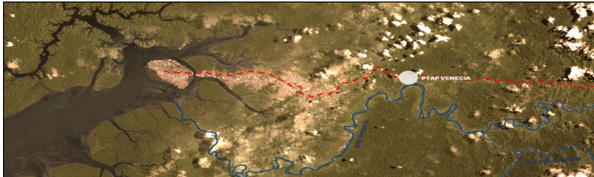
Figura No. 3 – Localización de la PTAP Venecia

La Planta de Tratamiento de Agua Potable Venecia, queda ubicada en la vía Loboguerrero-Buenaventura a la altura del corregimiento de Córdoba como se puede apreciar en la Figura No. 3