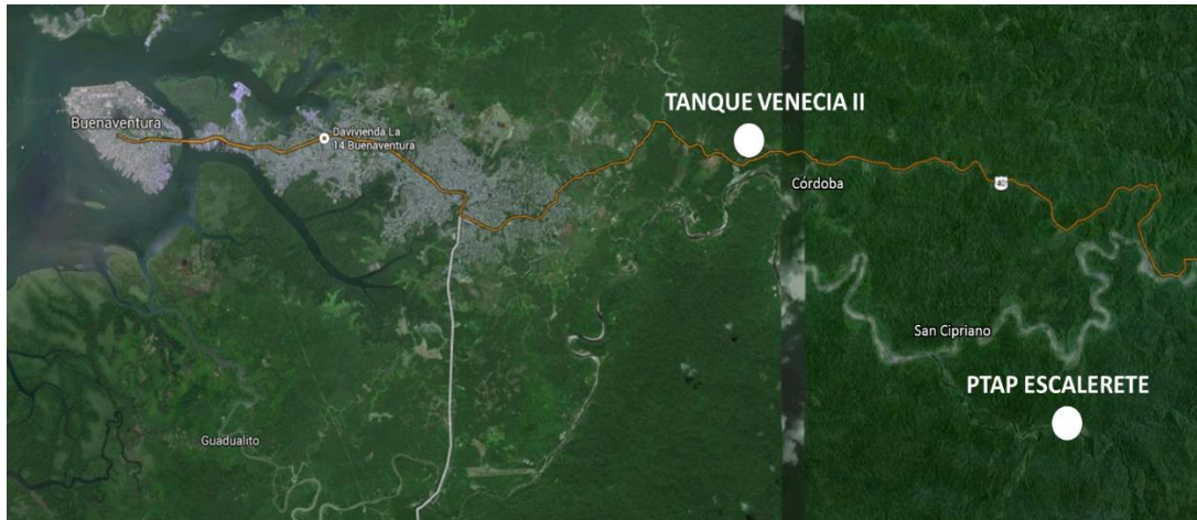
Figura No. 2 – Localización de la PTAP Escalerete

La altitud en la zona insular está en 2 metros sobre el nivel del mar, la PTAP Escalerete se encuentra aproximadamente a una altitud de 155 m.s.n.m. y la PTAP Venecia está en la cota de 102 m.s.n.m.