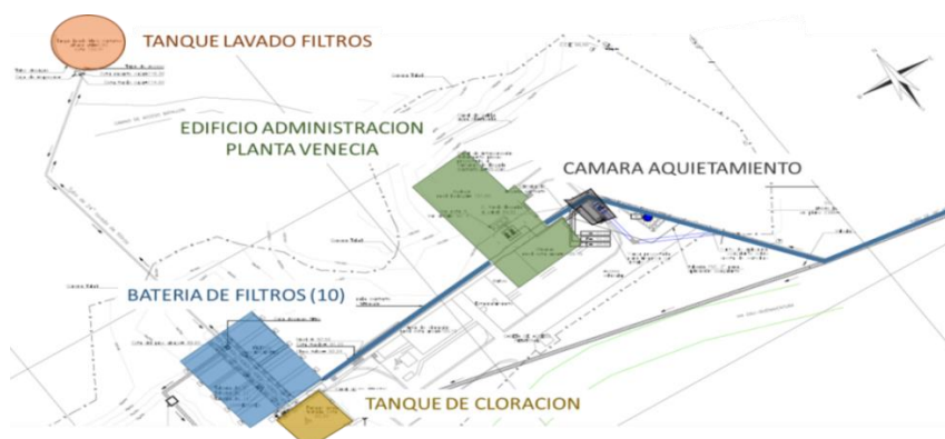
Figura No. 1 – Esquema funcionamiento tipo filtración directa Planta de Tratamiento de Agua Potable Venecia – 1200 lps

La planta de tratamiento de agua potable – PTAP – de Venecia fue construida en el año 1983 de filtración directa con capacidad para tratar 1.200 l/s de agua. El agua cruda ingresa a la planta de Venecia por medio de una tubería de 39” en CCP que viene desde la planta de tratamiento de agua potable de Escalerete donde previamente pasa por un desarenador (línea No. 1 en la planta de Escalerete). Una vez el agua llega a planta de Venecia, ingresa a una cámara de aquietamiento donde se disipa la energía. Esta cámara no cuenta con una válvula de entrada que permita cerrar la entrada de agua en caso que se necesite. Dicho cierre se debe realizar desde Escalerete, lo cual es un inconveniente operativo ya que en casos de emergencia no se podría reaccionar rápidamente para evitar la entrada de agua a la planta.