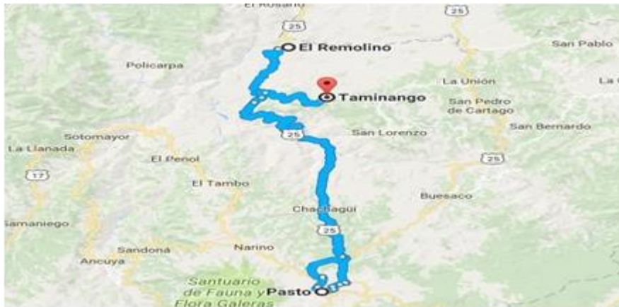
Figura 1 – Localización General del Proyecto

Al Norte: con el Departamento del Cauca (Municipio de Mercaderes) y el Municipio del Rosario, El Sur: con los municipios de Chachagüí y el Tambo, El Oriente: con el municipio de San Lorenzo El Occidente: con los municipios de El Peñol, Policarpa y El Rosario.