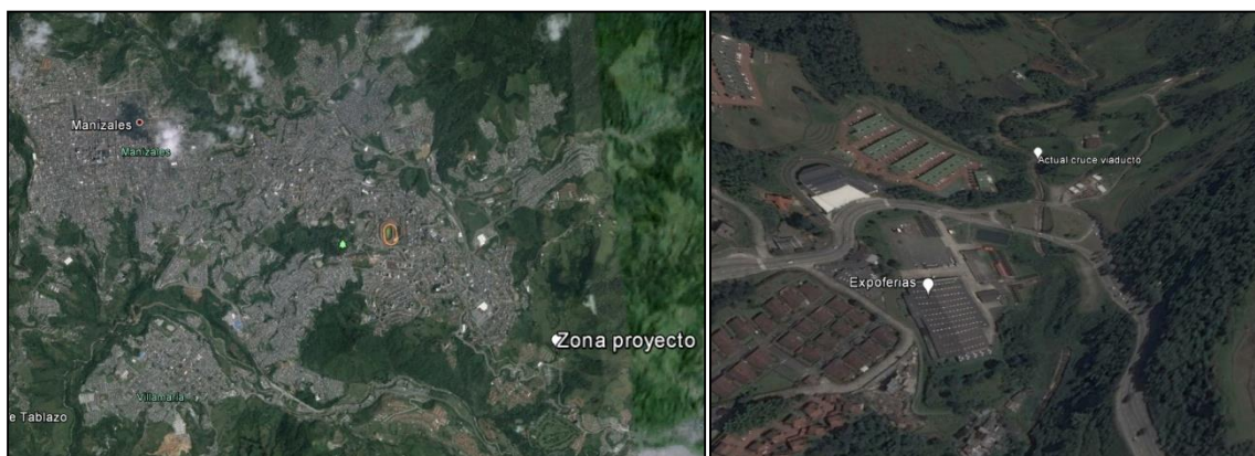
Figura 2 – Localización específica proyecto Paso Subfluvial El Perro – Manizales, Caldas

El proyecto se localiza en el Municipio de Manizales, Departamento de Caldas. Manizales está ubicada en el centro occidente de Colombia, sobre la Cordillera Central de los Andes, cerca del Nevado del Ruiz, y en el centro de las tres principales ciudades de Colombia, en el llamado triángulo de oro. La distancia entre Manizales y Bogotá es de 303 km. Entre Manizales y Medellín hay 194 km, y entre Manizales y Cali hay 263 km. Está comunicada con las capitales vecinas de Pereira y Armenia a través de la Autopista del Café.