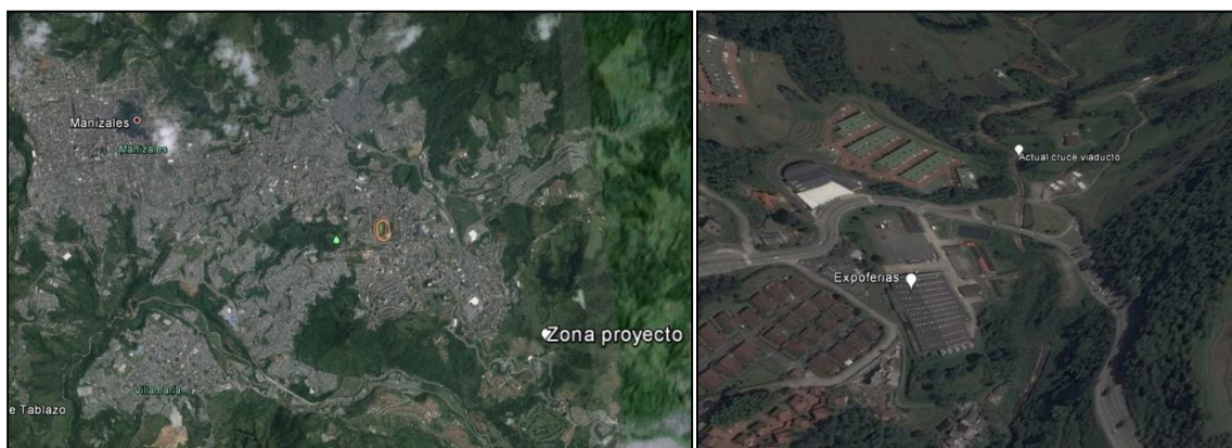
Figura 2 – Localización específica proyecto Paso Subfluvial El Perro – Manizales, Caldas

El proyecto se localiza en el Municipio de Manizales, Departamento de Caldas. Manizales está ubicada en el centro occidente de Colombia, sobre la Cordillera Central de los Andes, cerca del Nevado del Ruiz, y en el centro de las tres principales ciudades de Colombia, en el llamado triángulo de oro. La distancia entre Manizales y Bogotá es de 303 km. Entre Manizales y Medellín hay 194 km, y entre Manizales y Cali hay 263 km. Está comunicada con las capitales vecinas de Pereira y Armenia a través de la Autopista del Café.