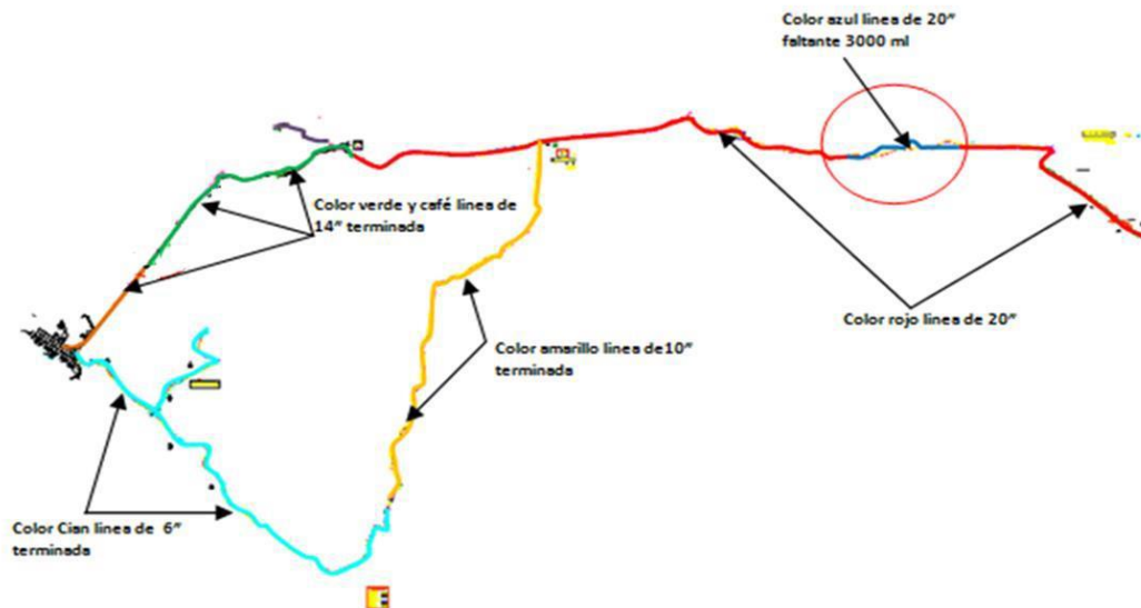
Esquema de proyecto sistema acueducto Regional del Norte del Cauca