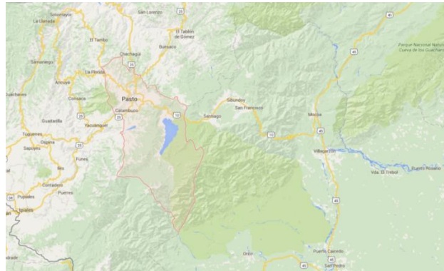
Figura 1 – Localización General Municipio de Pasto – Nariño