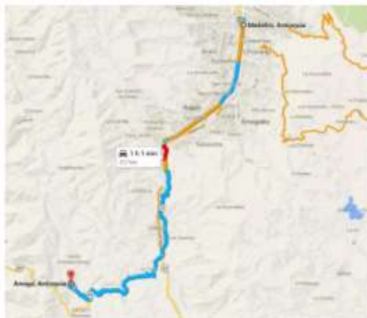
Figura 1 – Localización General Municipios Amagá Departamento de Antioquia