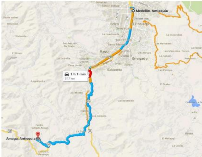
Figura 1 – Localización General Municipios Amagá Departamento de Antioquia

El Municipio de Amagá está situado en la subregión Suroeste del departamento de Antioquia. Limita al norte con el municipio de Angelópolis, al sur con los municipios de Fredonia y Venecia, al oriente con el municipio de Caldas y al occidente con el municipio de Titiribí. Su cabecera municipal está a 36 km y una hora en vehículo de la ciudad de Medellín.