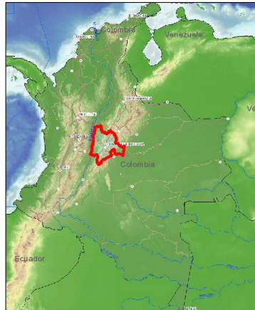
○ Figura No 2. Localización Departamento de Cundinamarca.