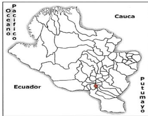
Mapa 1. Ubicación del Municipio de Gualmatan en el Departamento de Nariño.

Norte: Con el Páramo de La Gorgonia, línea divisoria del municipio de Iles, con el Páramo de Sapuyes y el Municipio de Ospina Sur: Con la vereda loma de Zuras y el corregimiento de San Juan Municipio de Ipiales Oriente: Con el Municipio de El Contadero, desde la desembocadura de la quebrada de Honda o Boyacá hasta la parte alta y posterior de la Gorgonia Occidente: Con el Corregimiento de José María Hernández, Municipio de Pupiales, desde la desembocadura del riachuelo Cuatis hasta el Purgatorio