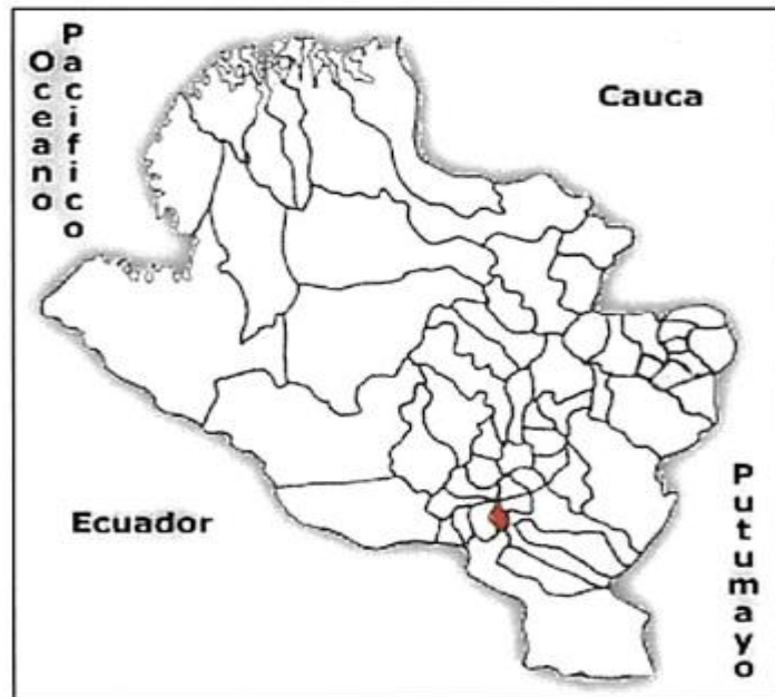
Mapa 1. Ubicación del Municipio de Gualmatan en el Departamento de Nariño

Extensión Total: Tiene una extensión territorial de 36 km 2 Extensión área urbana: 0.72 km 2 Extensión área rural 35.28 km 2 Altitud de la cabecera municipal 2930 msnm Temperatura media : 13°C