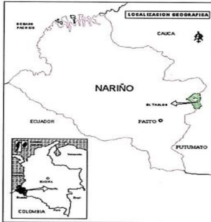
Mapa 1. Ubicación del Municipio de Tablón de Gómez

El municipio de El Tablón se encuentra ubicado geográficamente en las coordenadas: